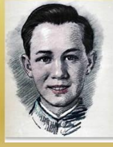
Боря Цариков Герой Советского Союза