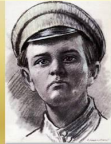
Миша Гаврилов пионер-герой