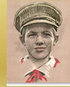
Саша Кондратьев пионер-герой