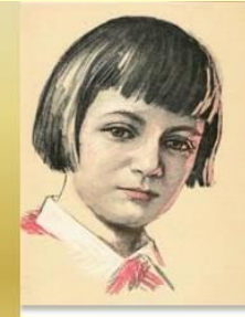
Люся Герасименко пионер-герой