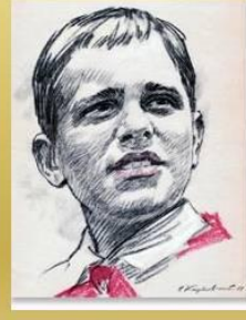
Костя Кравчук пионер-герой