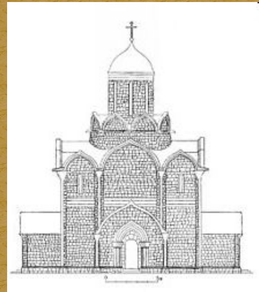
Успенский собор Ивана Калиты. Реконструкция С. В. Заграевского

«Если ты, — сказал святитель великому князю, — успокоишь старость мою и возведешь здесь храм Богоматери, то будешь славнее всех иных князей, и род твой возвеличится, кости мои останутся в сем граде, святители захотят обитать в оном, и руки его взыдут на плечи врагов наших»