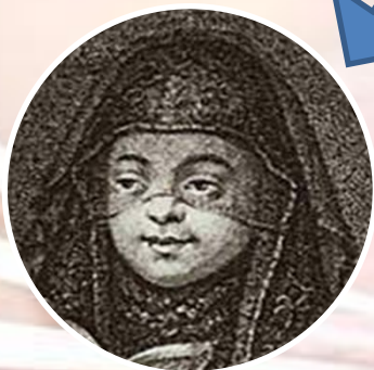
1 жена Евдокия Лопухина