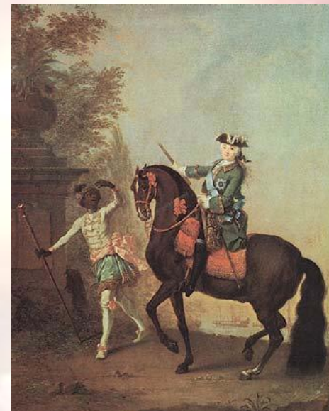
ЕЛИЗАВЕТА ПЕТРОВНА [1709, Петербург —1762], русская императрица (1741 — 1761). Дочь Петра I и Екатерины I.