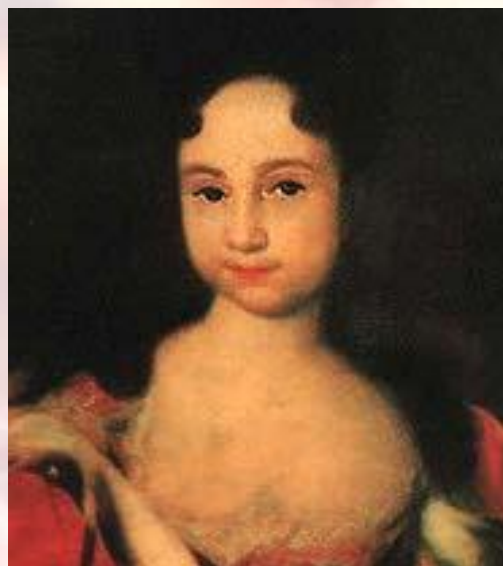
АННА ПЕТРОВНА (1708-1728), дочь Петра I. С 1725 жена герцога Гольштейн-Готторпского, мать Петра III