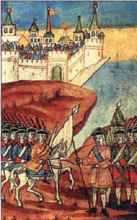
Первый Азовский поход

для продолжения борьбы с Турцией Россия нуждалась в союзниках