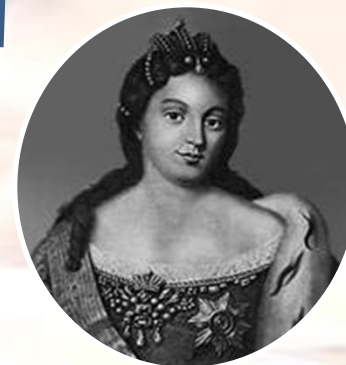
2 жена Марта Скавронская (будущая императрица Екатерина I)