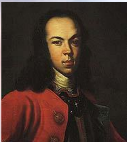
АЛЕКСЕЙ ПЕТРОВИЧ [1690—1718] — царевич, старший сын Петра I от брака с Е. Ф. Лопухиной.