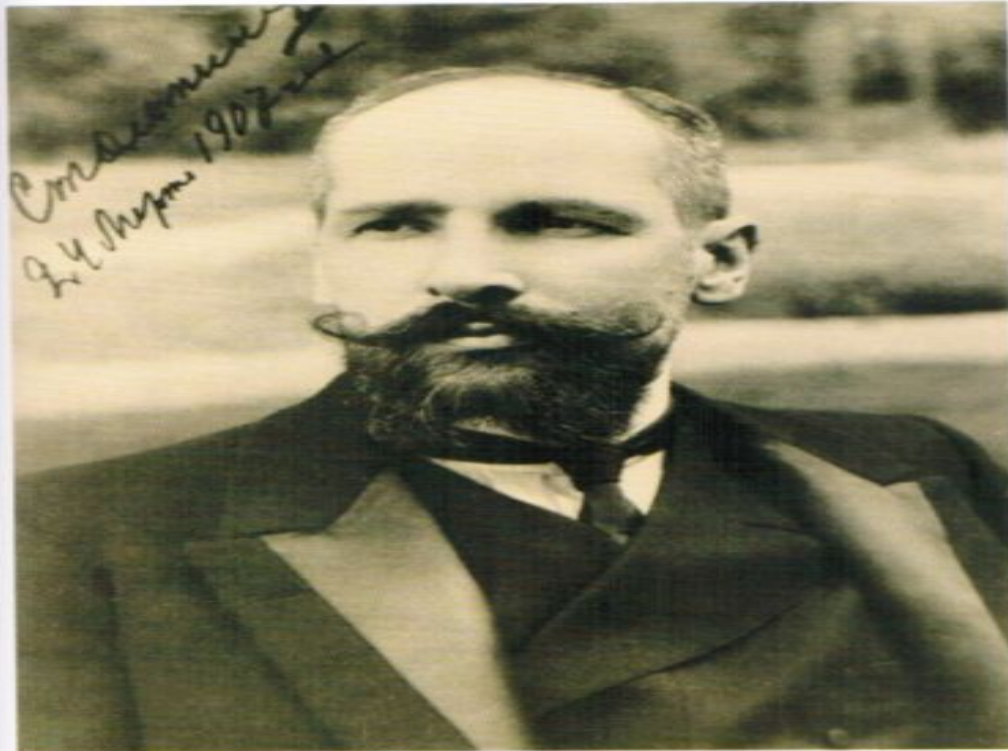
Председатель Совета Министров, Статс-Секретарь П. А. Столыпин