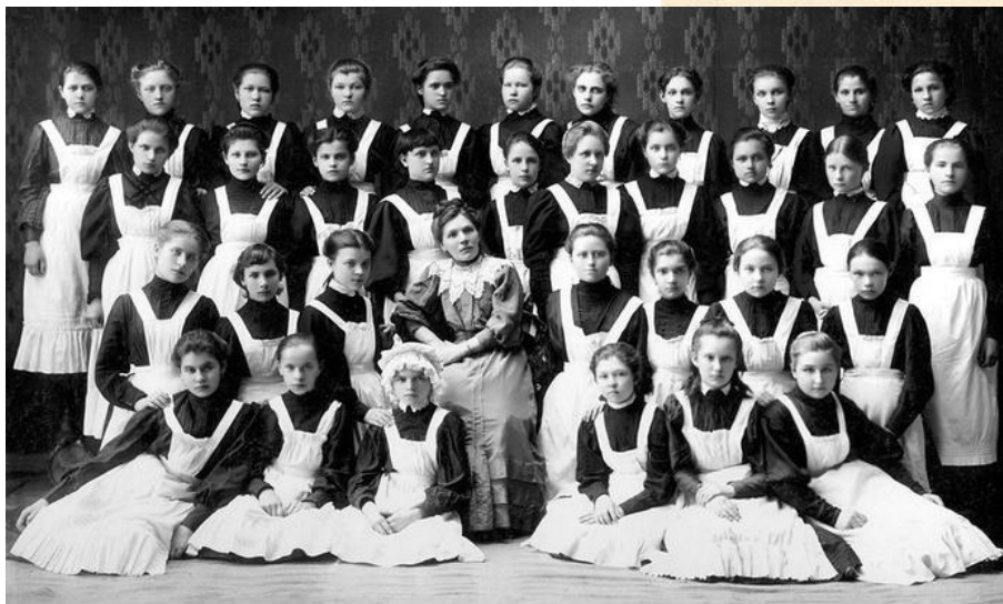
Гвери (въ память освобождения tvrilife.ru )