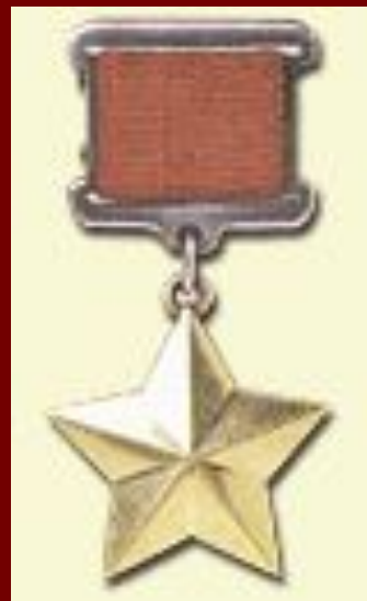
Медаль "Золотая Звезда"