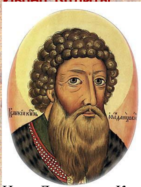
Иван Данилович Калита (1325-1340)