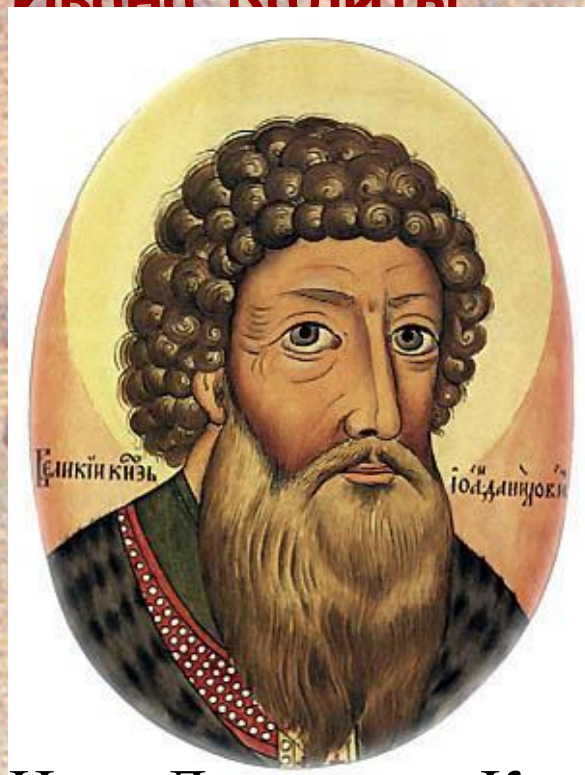
Иван Данилович Калита (1325-1340)