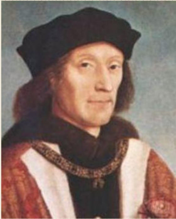
Генрих VII Тюдор

1485 г. – королем Англии провозглашен Генрих Тюдор (Генрих VII).