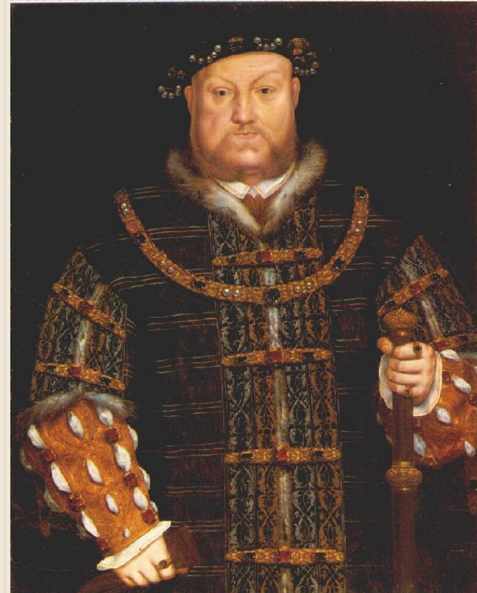
Генрих VIII Тюдор

1534 г. – парламент провозгласил английскую церковь независимой от Рима, а ее верховным главой стал король.