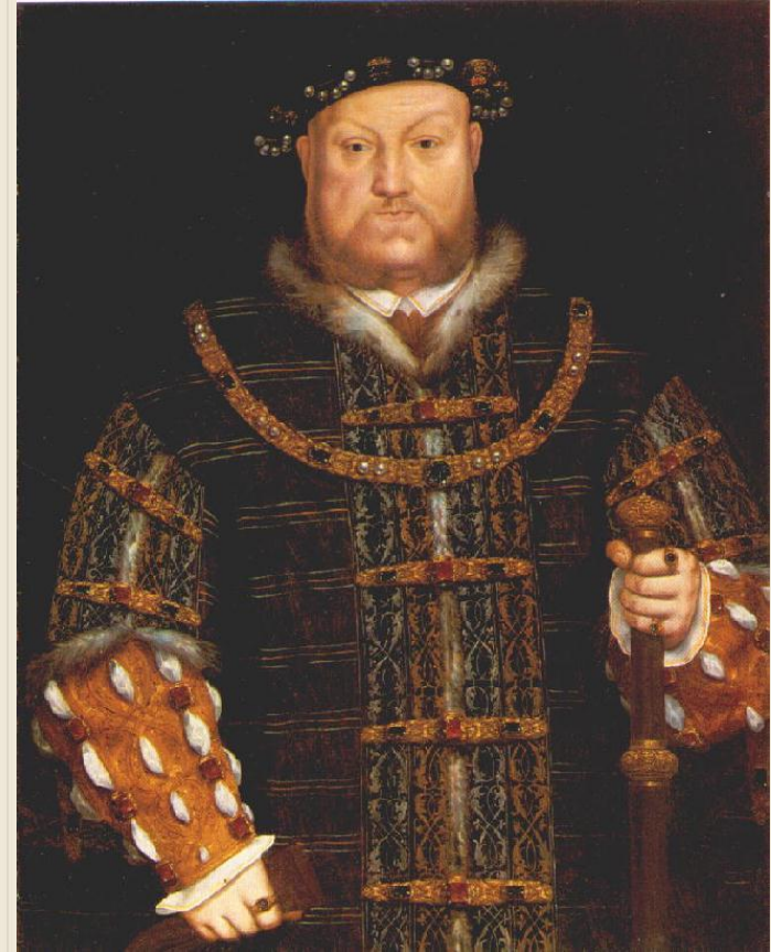
Генрих VIII Тюдор

1534 г. – парламент провозгласил английскую церковь независимой от Рима, а ее верховным главой стал король.