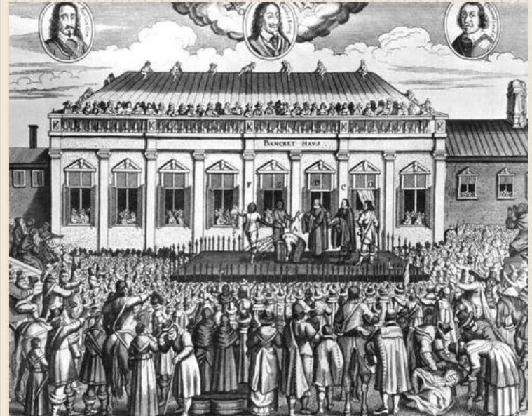
Казнь Карла I

Май 1649г. - Англия объявлена республикой. Был создан исполнительный орган Государственный совет во главе с Кромвелем.