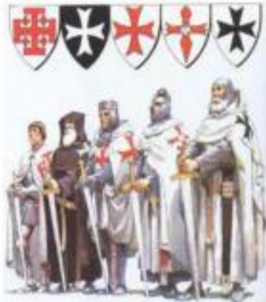
Орден Святого Иона Иерусалимского

Мальтийский орден был основан в Средние века как монашеско – рыцарский орден. Его члены видели свою миссию в том, чтобы лечить и защищать паломников в Святую землю. Поскольку рыцарям приходилось часто сражаться, чтобы отстоять свои владения, Орден приобрел довольно воинственные черты.