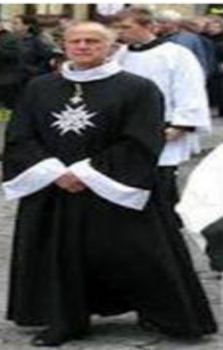
ПОЧЁТНЫЙ РЫЦАРЬ МАЛЬТИЙ СКОГО ОРДЕНА, 21 ВЕК

Все подчинялись Гроссмейстеру, или великому магистру, который в свою очередь подчинялся Папе Римскому, а не правителям на землях которых располагались владения ордена. У них был свой Устав , утверждённый Папой Римским и особая, отличительная одежда . Они вели военную деятельность Рыцарей становилось всё больше. С 1100-по 1400 гг. было образовано около 20 духовных рыцарских орденов. Из них три ордена были самыми влиятельными: - ГОСПИТАЛЬЕРЫ И ОАНИТЫ, (МАЛЬТИЙС КИЙ) -ОРДЕН ТЕМПЛИЕРОВ-ХРАМОВНИКОВ, -ТЕВТОНСКИЙ (НЕМЕЦКИЙ ОРДЕН)