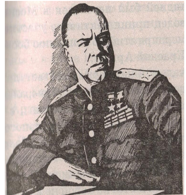
Г. К. Жуков