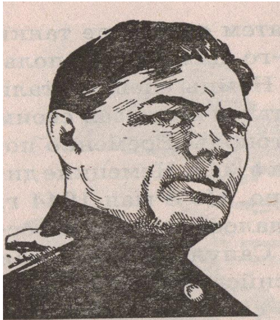
А. М. Василевский