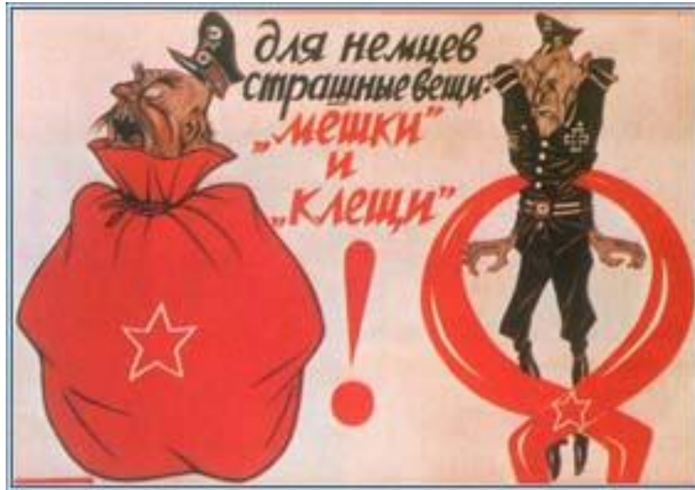
В. Дени. Плакат, посвященный окружению и разгрому германских войск

(окружение немецко-фашистских войск под Сталинградом)