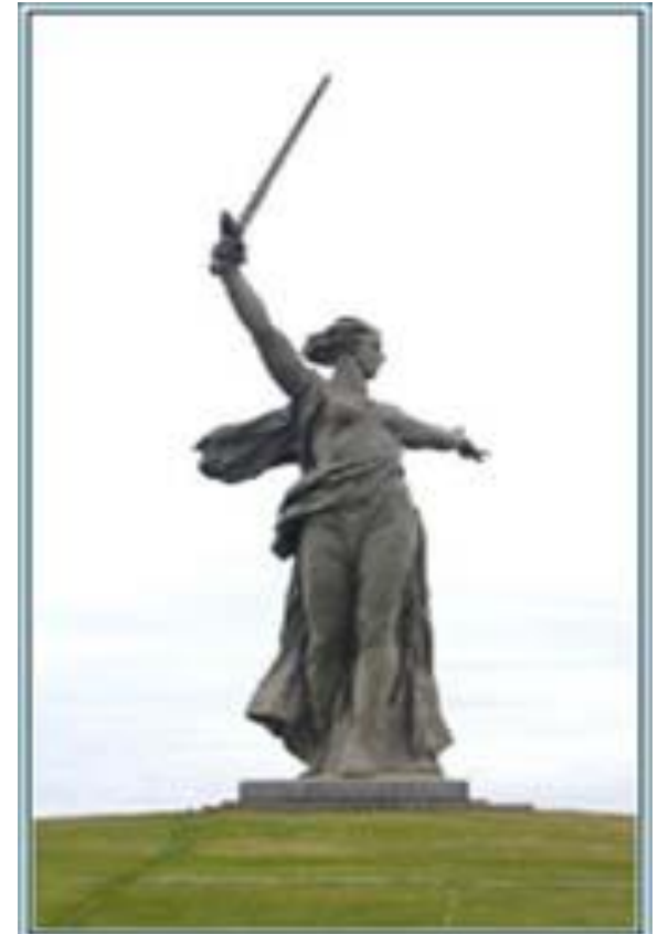
Главная высота России 102.0 Мамаев Курган

В Сталинградском сражении особенно кровопролитные бои шли за Мамаев курган – господствующую над городом высоту. Много раз курган переходил из рук в руки. В конце сражения он был весь усеян осколками и залит кровью.