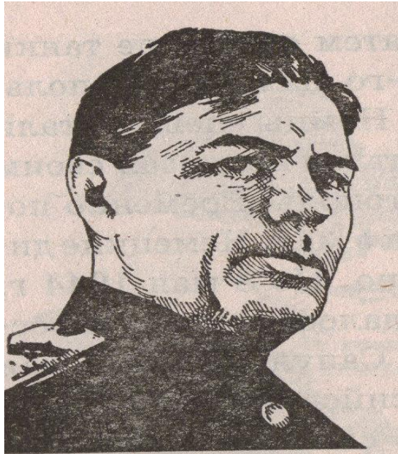
А. М. Василевский