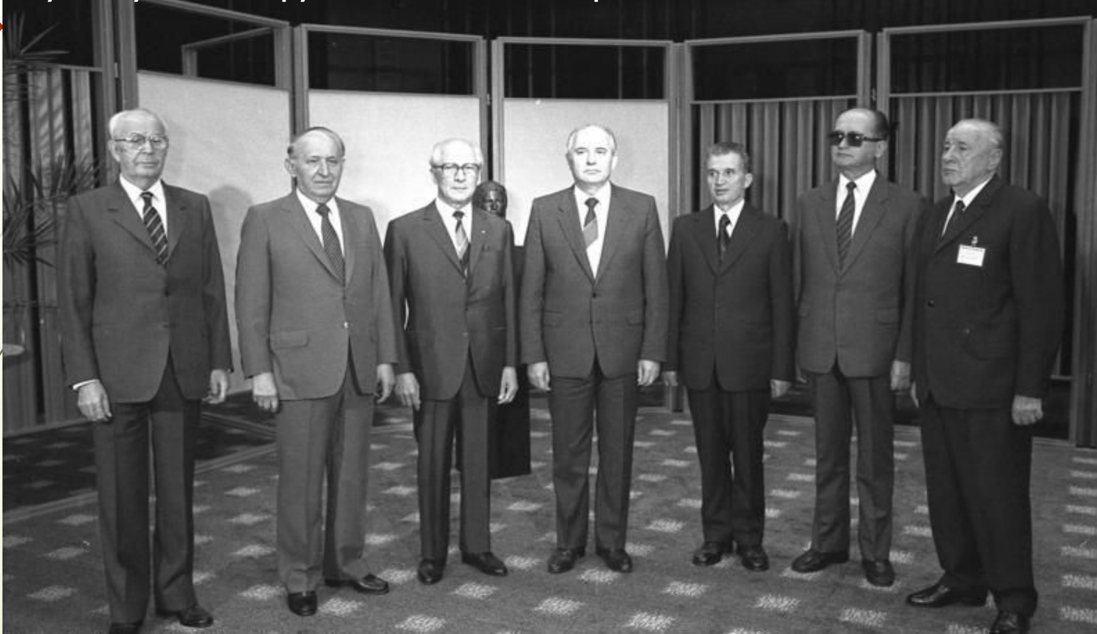
Густав Гусак, Тодор Живков, Эрих Хонеккер, Михаил Горбачёв, Николае Чаушеску, Войцех Ярузельский, Янош Кадар. 1987