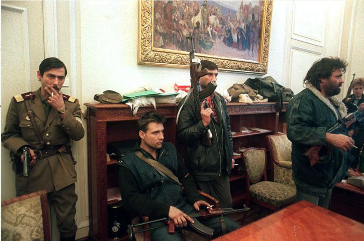
Революционеры во дворце Чаушеску

Управление страной перешло в руки Фронта Национального Спасения, состоявшего в основном из бывших соратников Чаушеску. Во главе этого органа встал опальный партийный функционер Ион Илиеску . В 1990 г. он был избран президентом республики.