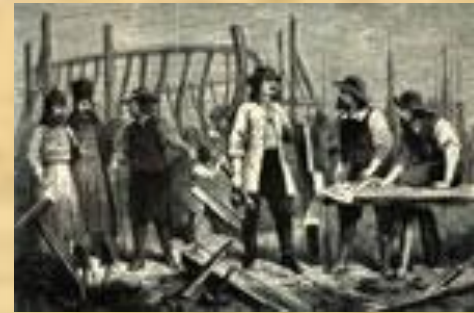
Петр на верфи

ОТВЕТ: ВСЕГО ПЁТР I ОСВОИЛ ОКОЛО 15 ПРОФЕССИЙ, В ТОМ ЧИСЛЕ ПЛОТНИКА, СТОЛЯРА, СЛЕСАРЯ, КУЗНЕЦА, ФЕЛЬДШЕРА, ПЕРЕВОДЧИКА, БУХГАЛТЕРА, КАРТОГРАФА, ШТУРМАНА, АРТИЛЛЕРИСТА, КОРАБЛЕСТРОИТЕЛЯ.