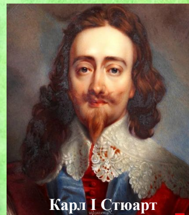
Карл I Стюарт