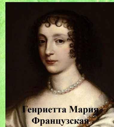
Генриетта Мария Французская