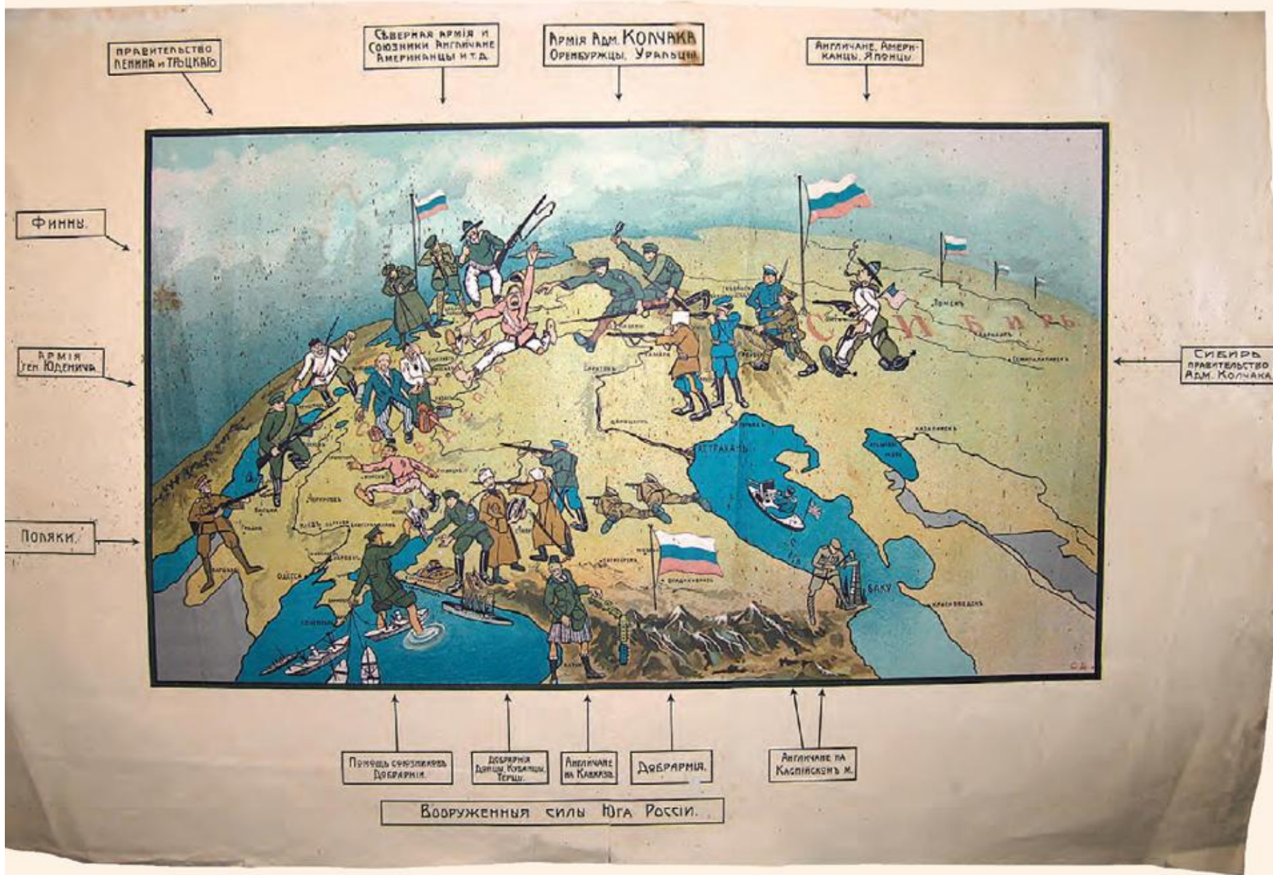
Белогвардейский плакат, изображающий состав антибольшевистских сил. 1919 г.