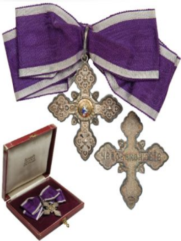
Орден Святой Екатерины 2 степени

Что жизнь, когда Отечество дороже? Да, у войны не женское лицо, Но кто сказал, что женщина не может Отечеству служить, в конце концов?