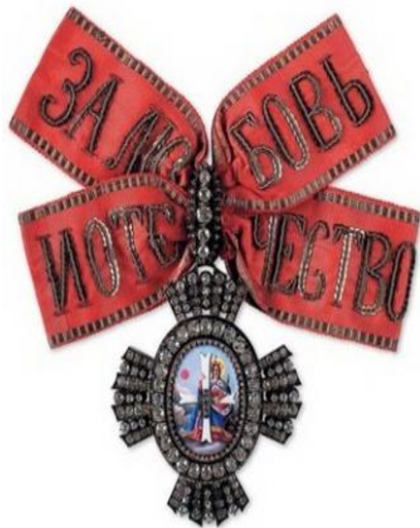
Орден Святой Екатерины II степени