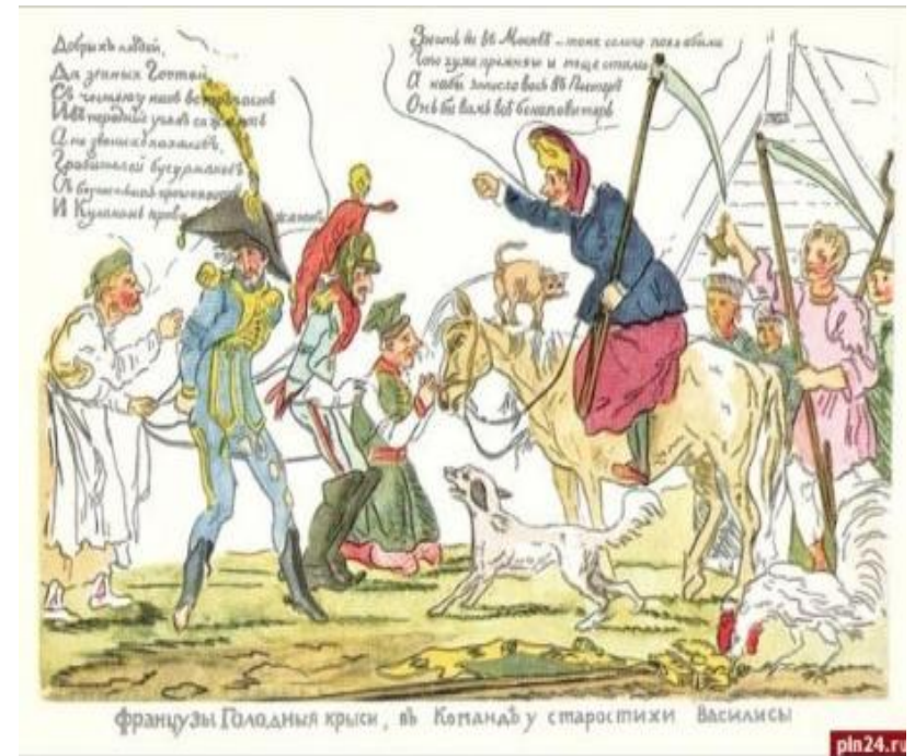
Карикатура 1812 года