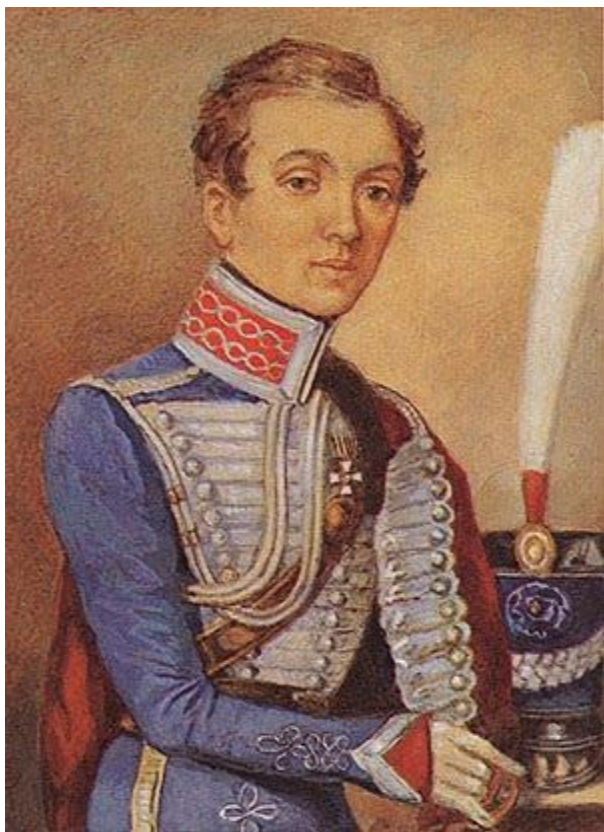
Надежда Дурова 1810 год