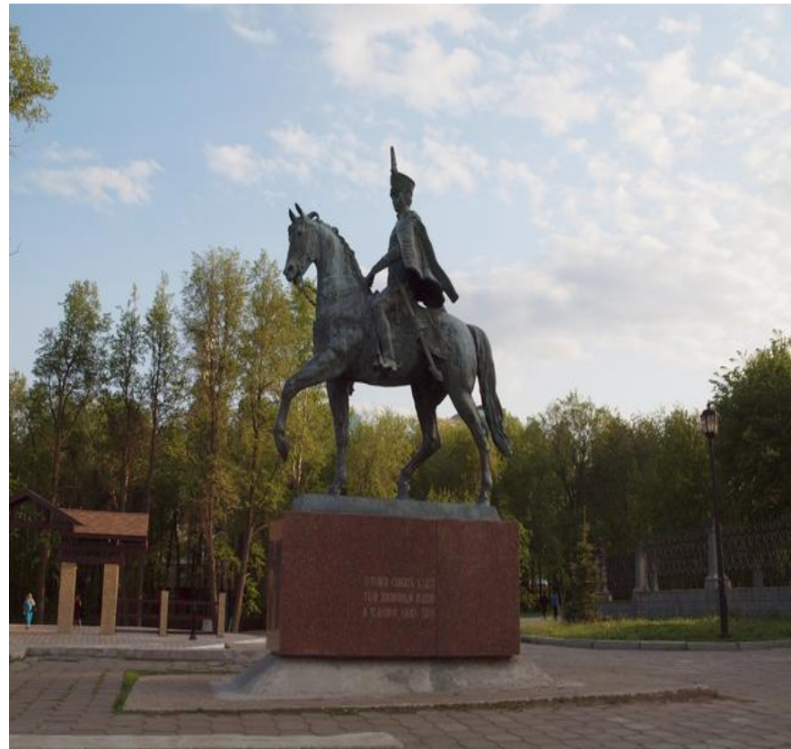
Конный памятник Н. Дуровой в Елабуге