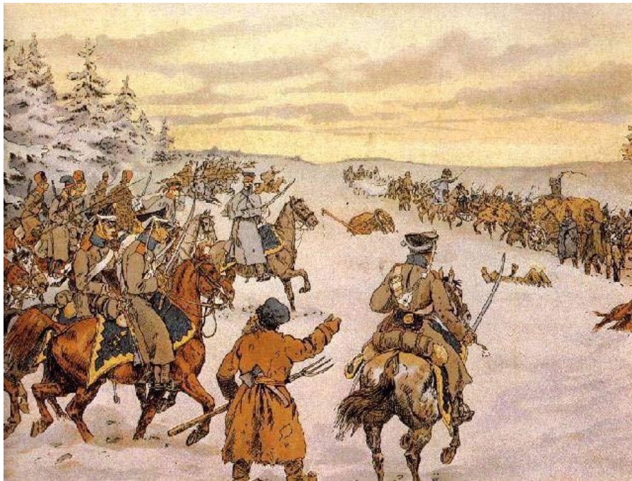
Отряд партизан 1812 год

“Что за страна? Жгут свои лучшие города, а воюют у них женщины и дети”