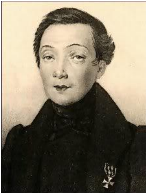
Надежда Андреевна Дурова (1783-1866)

«Все согласно признавали , что я достойна носила оружие»