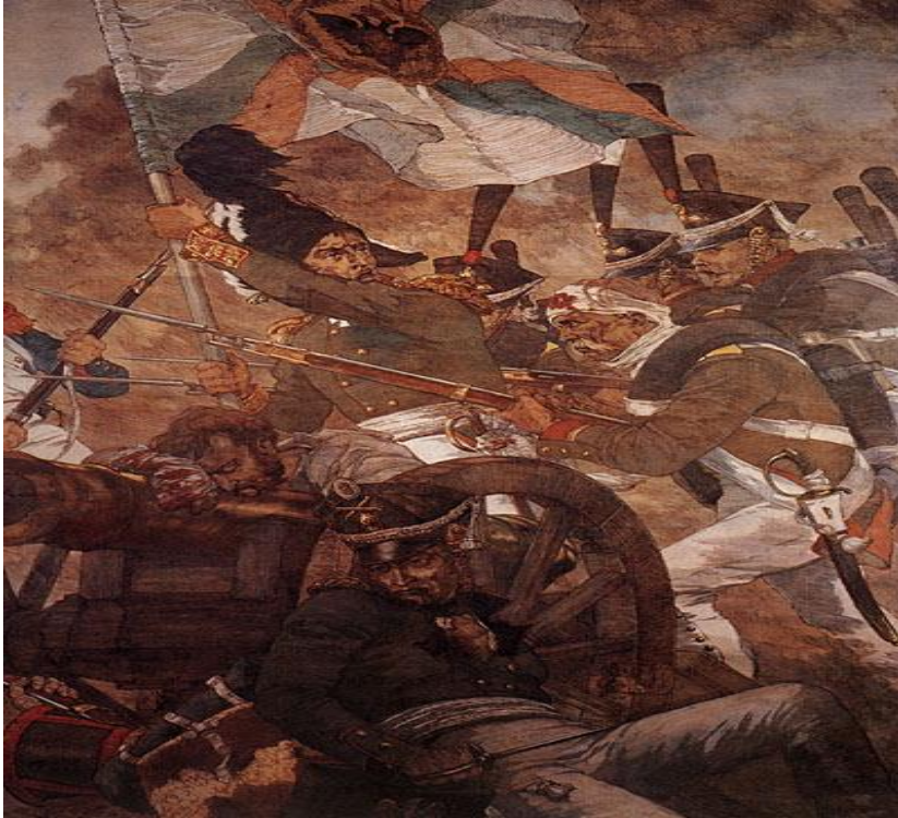
Подвиг генерала А.А.Тучкова