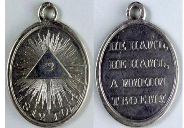
Медаль в память о войне 1812 года