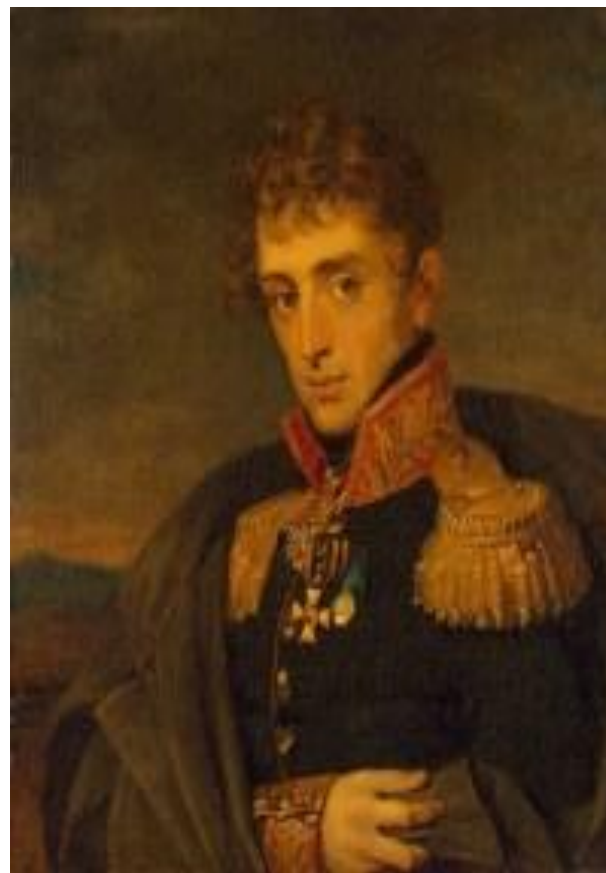
Александр Алексеевич Тучков (1778-1812)