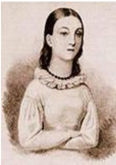
Надежда Дурова в 14 лет