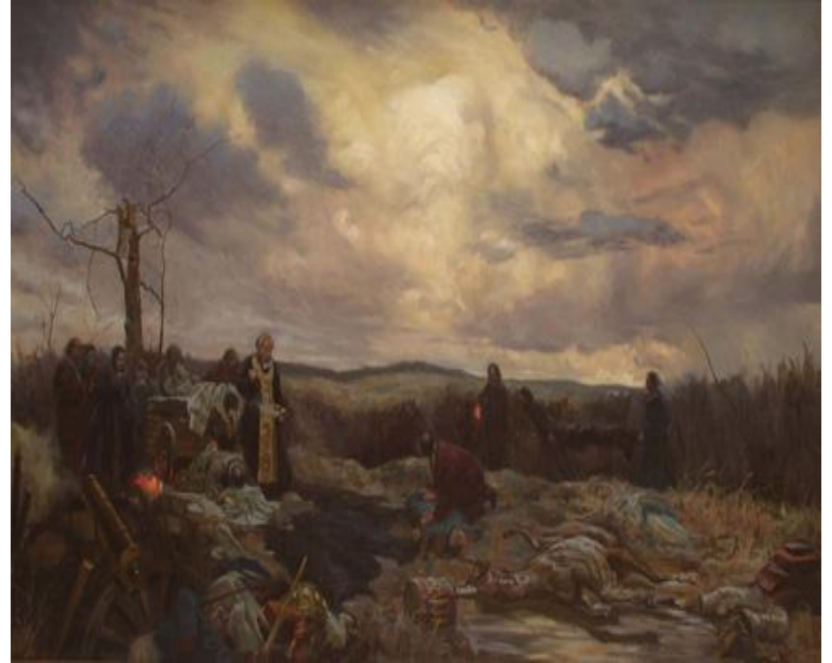
С. Кожин "М.М. Тучкова на Бородинском поле"