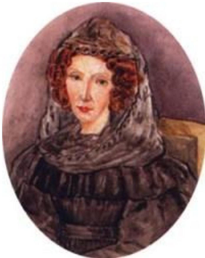
Маргарита Михайловна Тучкова (1781-1852)