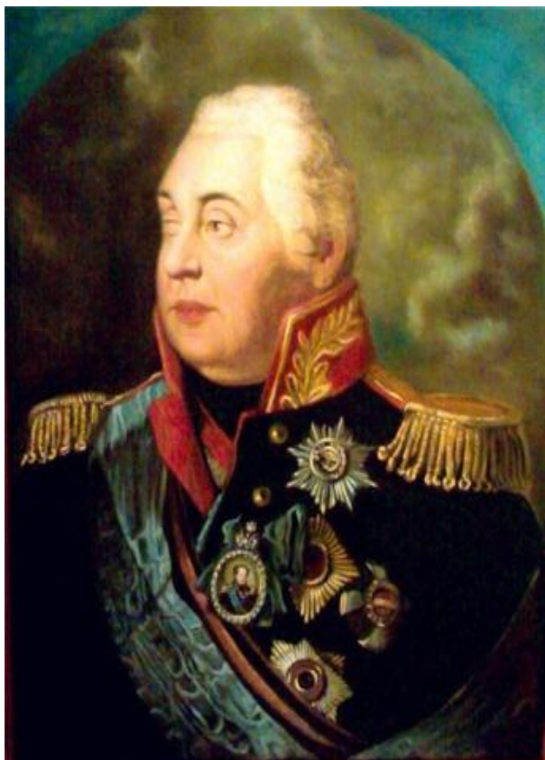
Главнокомандующий М.И. Кутузов