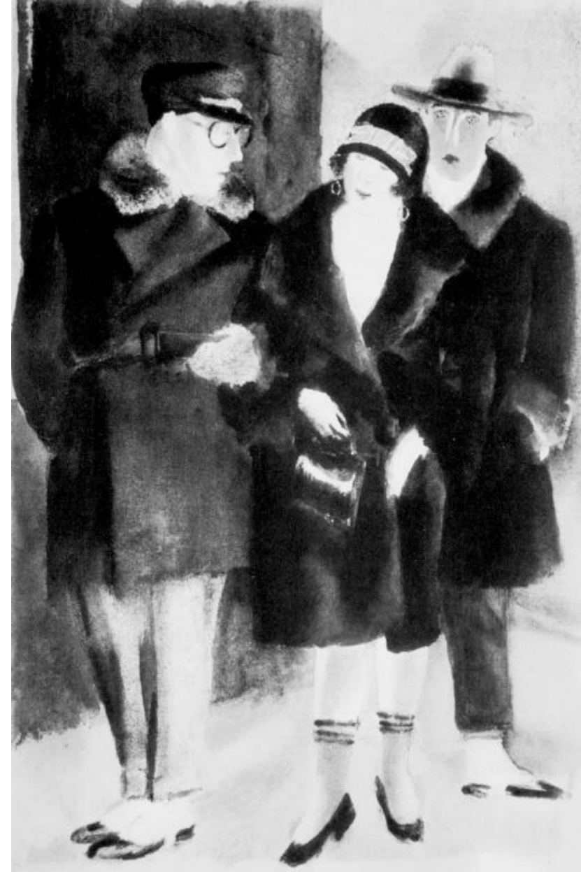
«Нэпманы» В.В. Лебедев. 1926 г.