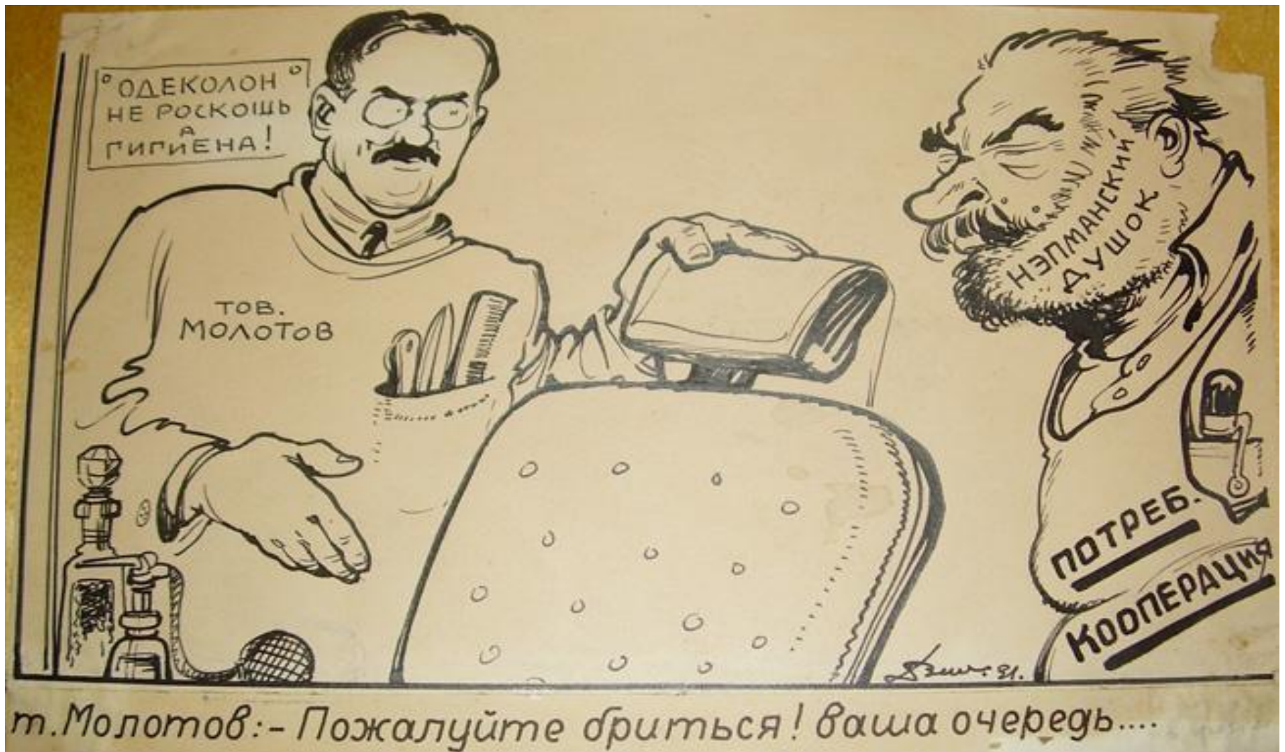
Рис. 16. Плакат «т. Молотов: Пожалуйста бриться! Ваша очередь».

Художник Ф. Весели (1931). Из собрания Ярославского художественного музея