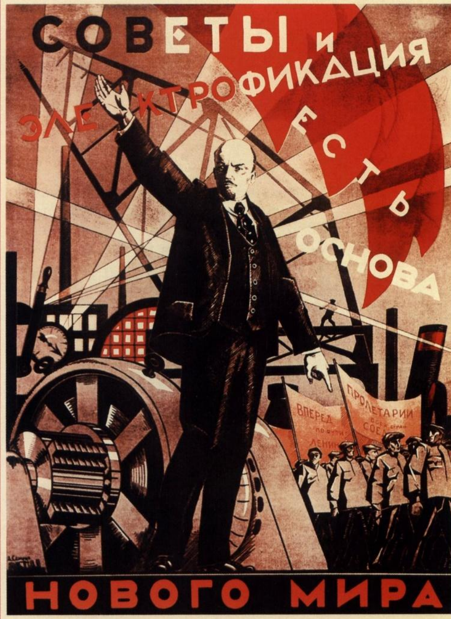
403. Самохвалов А. Советы и электрофикация есть основа нового мира. 1924