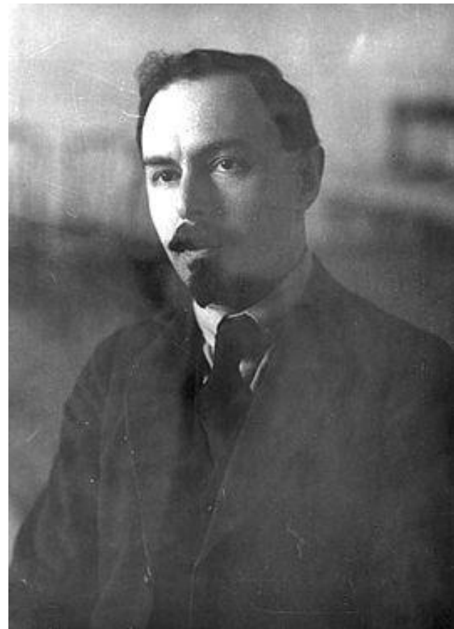
Я. Сокольников, нарком финансов.