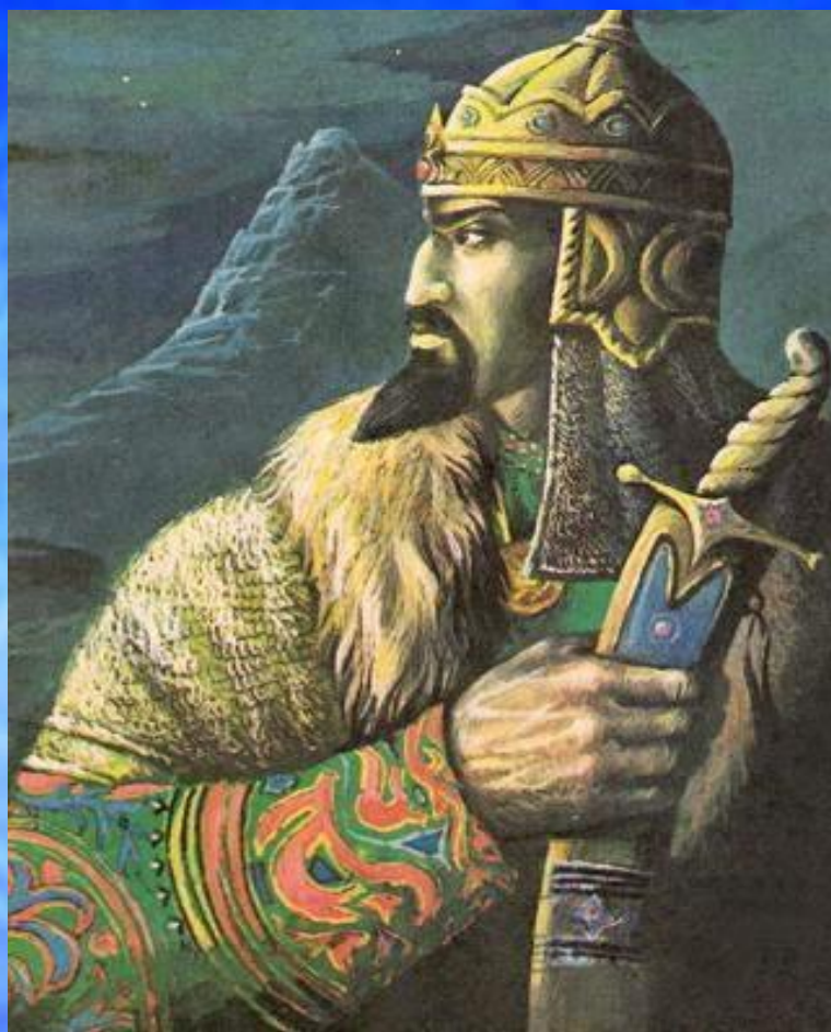
Кенесары Қасымұлы (1802-1847)

Кенесары Қасымұлы – хан, қазақтардың патшалық Ресей мен Қоқан хандығына қарсы ұлт-азаттық қозғалысының басшысы.