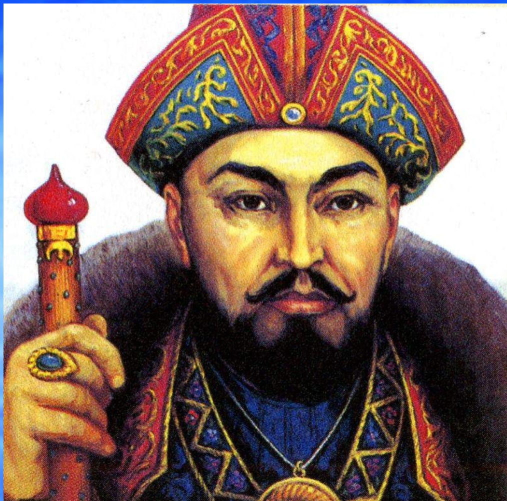
Абылай хан (1711-1781)