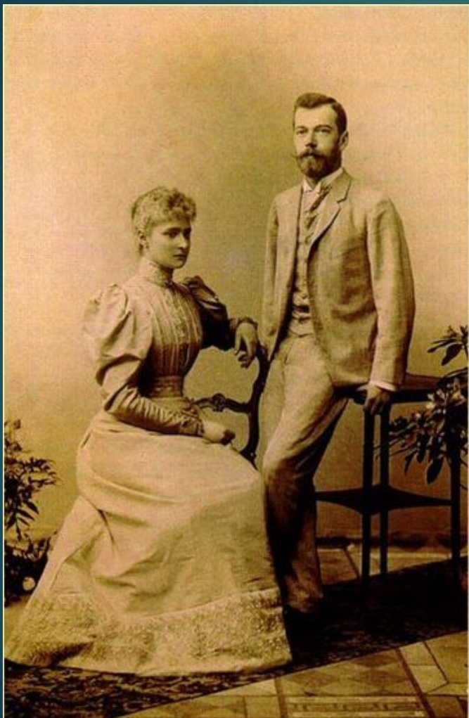
Цесаревич Николай Александрович и принцесса Алиса

Принцесса Алиса Виктория Елена Луиза Беатриса родилась 25 мая (7 июня) 1872 года в Дармштадте, столице небольшого германского герцогства, уже насильственно включенного к тому времени в Германскую империю. Отцом Алисы был Великий герцог Гессен-Дармштадтский Людвиг, а матерью — принцесса Алиса Английская, третья дочь королевы Виктории. В детстве принцесса Алиса (Аликс, как звали ее домашние) была веселым, живым ребенком, за что ее прозвали «Санни» (Солнышко). Одежда и еда детей были очень простыми. Но от дифтерии в возрасте тридцати пяти лет умерла ее мать. После пережитой трагедии (а ей было всего 6 лет) маленькая Аликс стала замкнутой, отчужденной, начала сторониться незнакомых людей; успокаивалась она только в семейном кругу. После смерти дочери королева Виктория перенесла свою любовь на ее детей, особенно на младшую, Аликс. Ее воспитание и образование проходили под контролем бабушки.