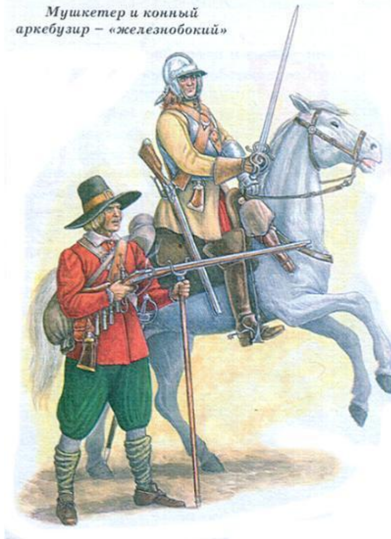
Мушкетер и конный аркебузир – «железнобокий»