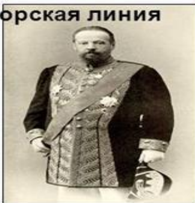
Сергей Юльевич Витте

Министр финансов, Экономические реформы – социальные реформы - Разрушение крестьянской общины, поддержка предприимчивых крестьян, уравнение в правах с другими сословиями, переселенческая политика