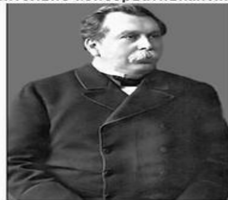
Плеве Вячеслав Константинович

(МВД, защитник русс устоев) - любые уступки оппозиции губительны - неприкосновенность крестьянской общины, неотчуждаемость наделов, усилить надзор за деревней - Инициатива д.б. за правительством