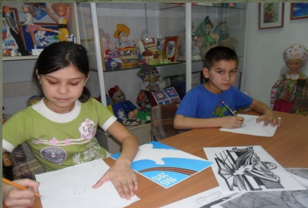
Составление эскиза для стенда. Изготовление мелких элементов для стенда.