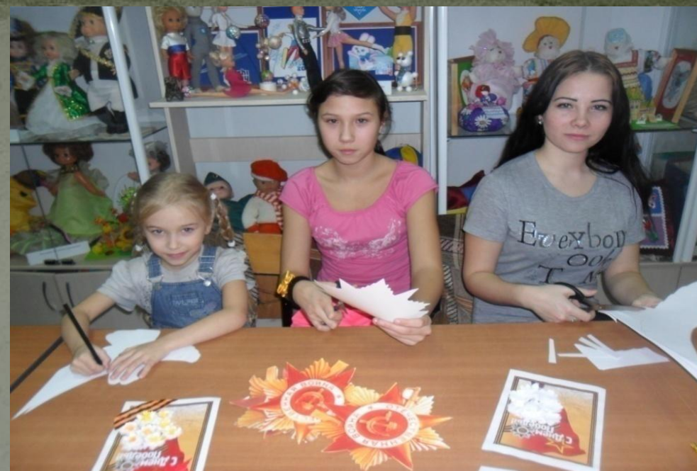
Изготовление Ордена Отечественной войны в технике 3D. Собрали информацию, провели экскурсию.