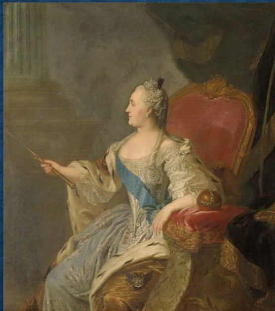
Коронационный портрет Екатерины II