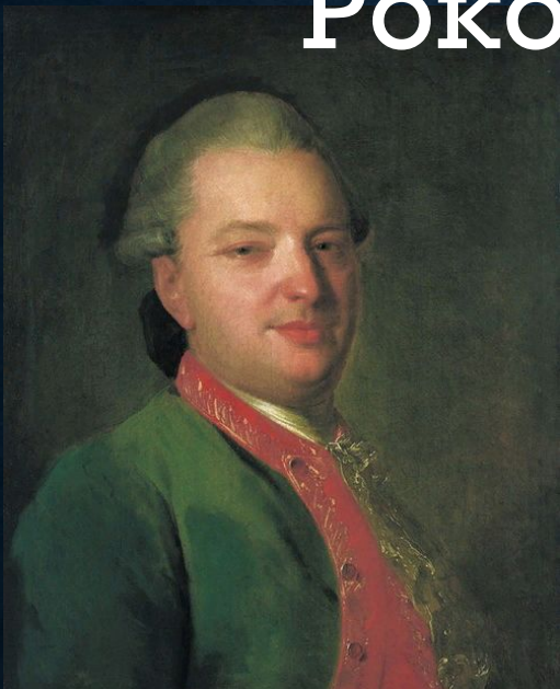
Портрет В. И. Майкова