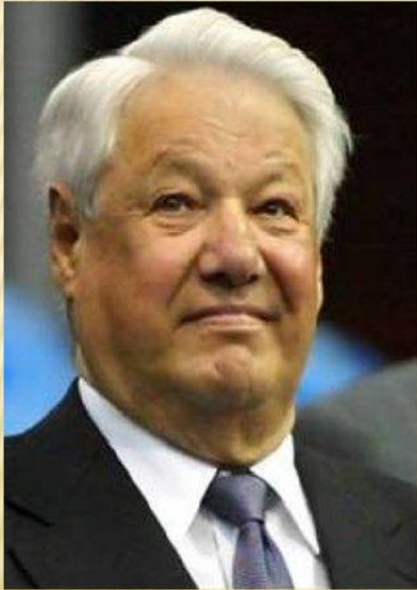
Борис Николаевич Ельцин, Президент РСФСР

28 октября 1991 г. - V съезд народных депутатов Б.Н. Ельцин - программа перехода к рынку