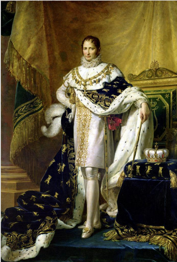
Жозе́ф Бонапа́рт , король Испании в 1808—1813 годах под именем Иосиф I Наполеон