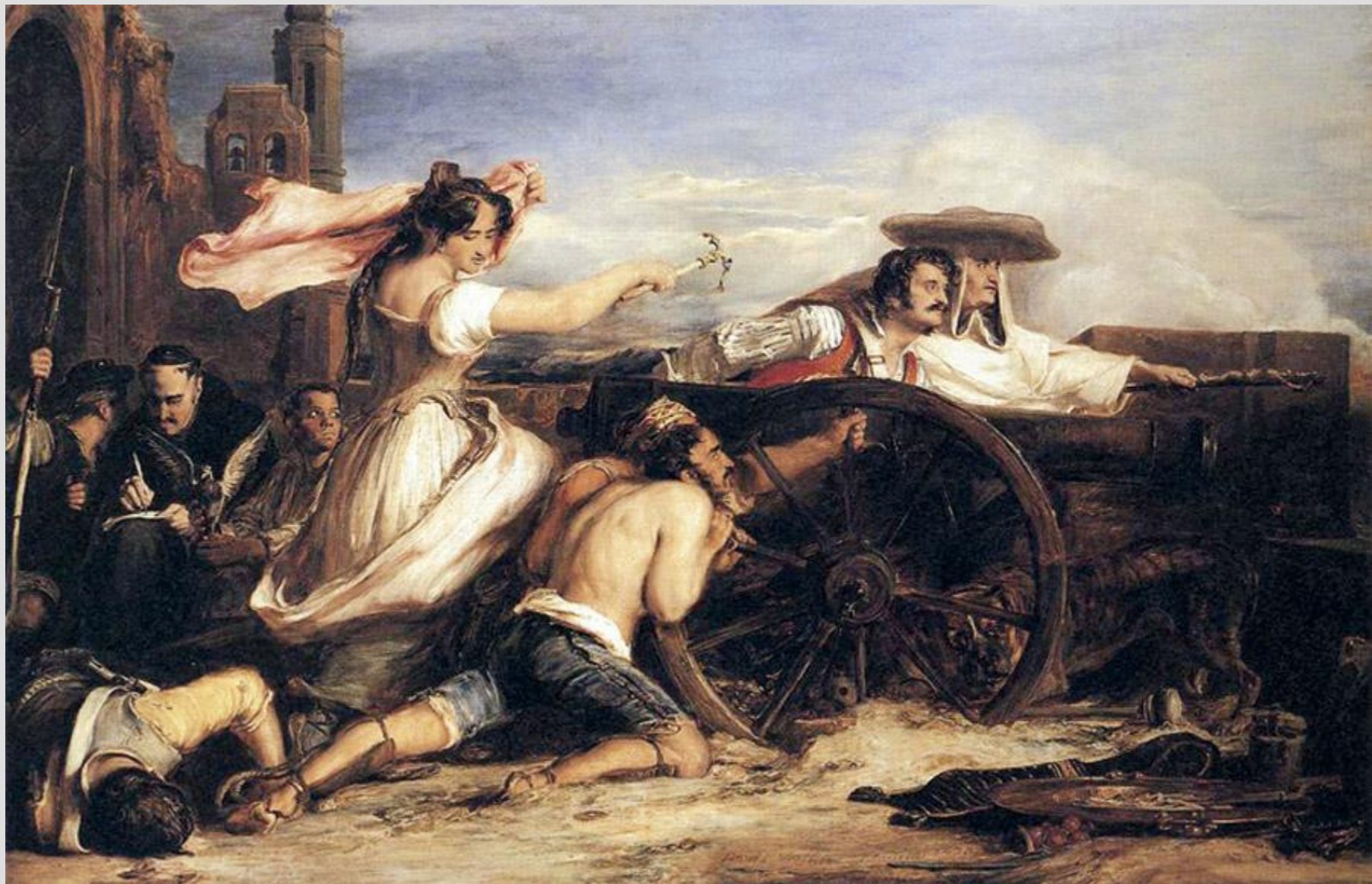
Защита Сарагосы Сэр Дэвид УИЛКИ