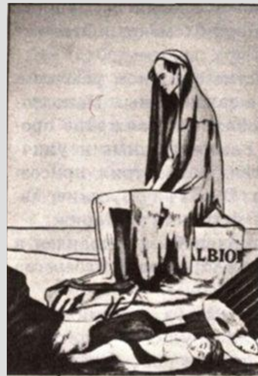
Англия после континентальной блокады. Сатирический рисунок.