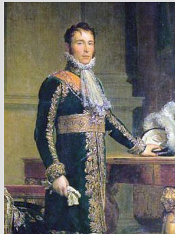
Богарне Евгений Наполеон - французский генерал, вице-король Италии (1805-14), пасынок Наполеона Бонапарта