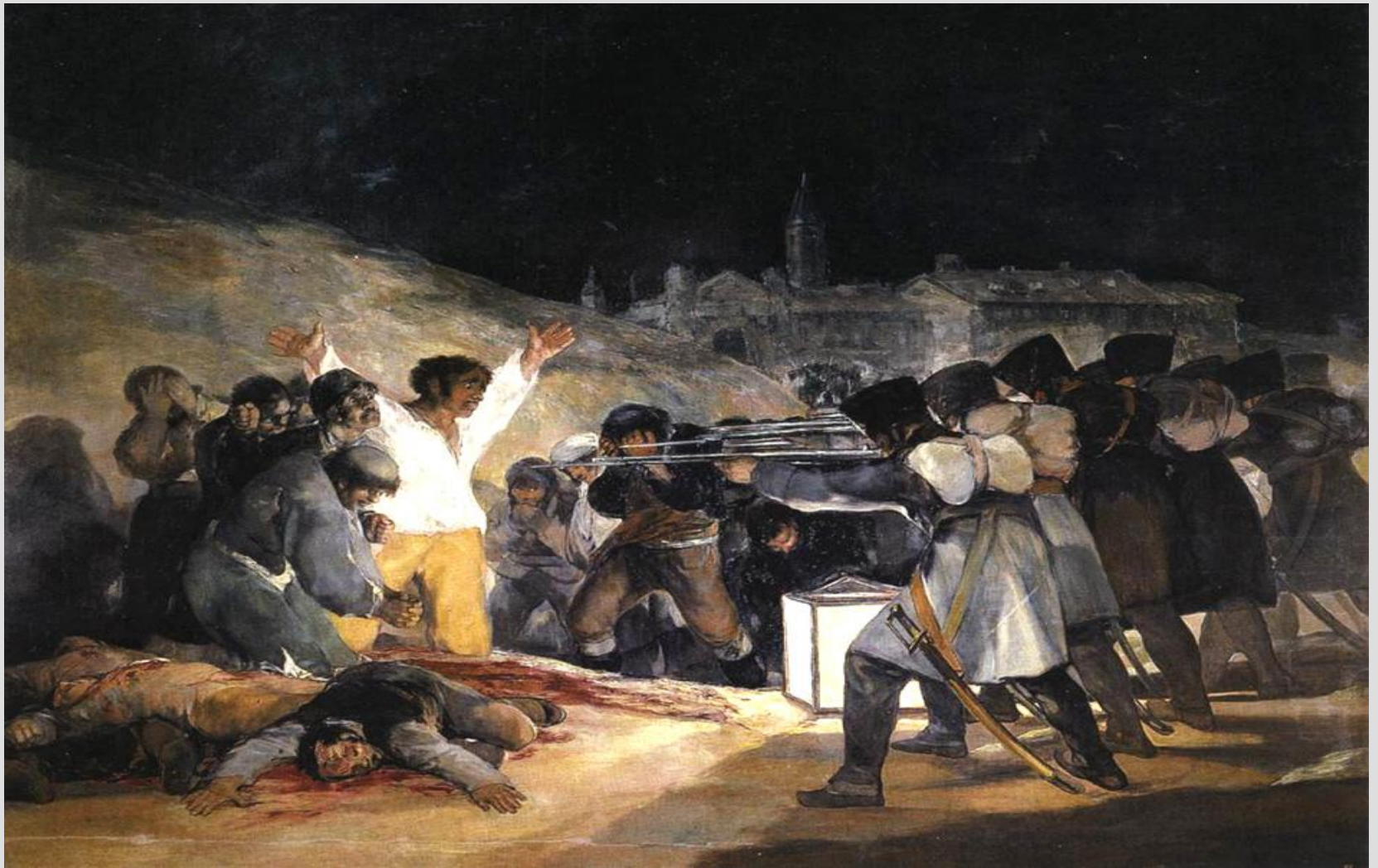
Расстрел повстанцев в ночь на 3 мая 1808 г. Мадрид. Франсиско ГОЙЯ