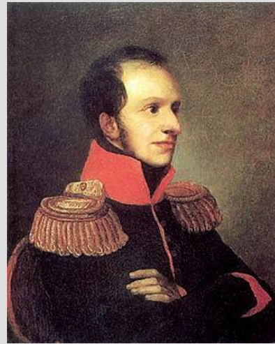
принц Георгий Ольденбургски й

1810 г. – таможенная война между Россией и Францией 1811 г. Франция присоединила владения герцога Ольденбургского