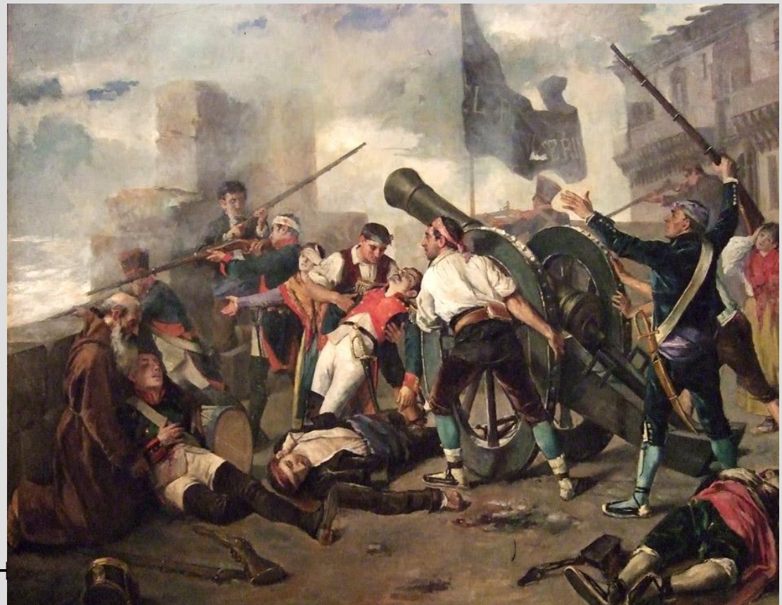
Восстание 2 мая 1808 г. в Мадриде Мануэль КАСТЕЛЛАНО