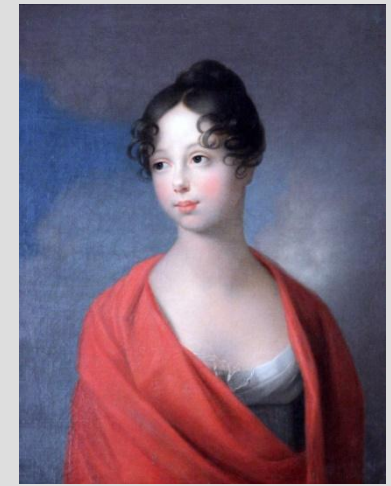
Екатерина Павловна, герцогиня Ольденбургская.