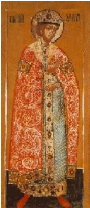
"Царевич Дмитрий" икона