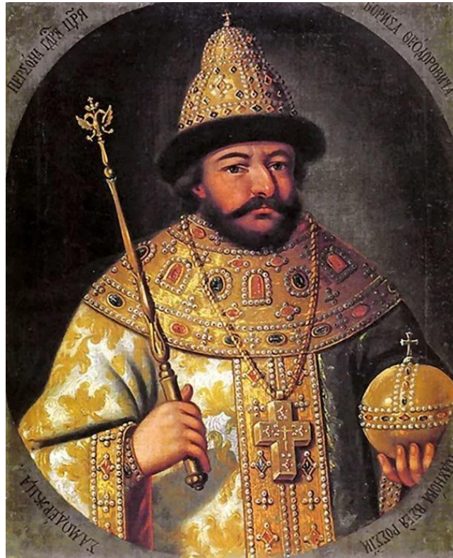
Борис Годунов (1598 - 1605)

Задание: Прочитайте п.5 и дайте характеристику новому царю.