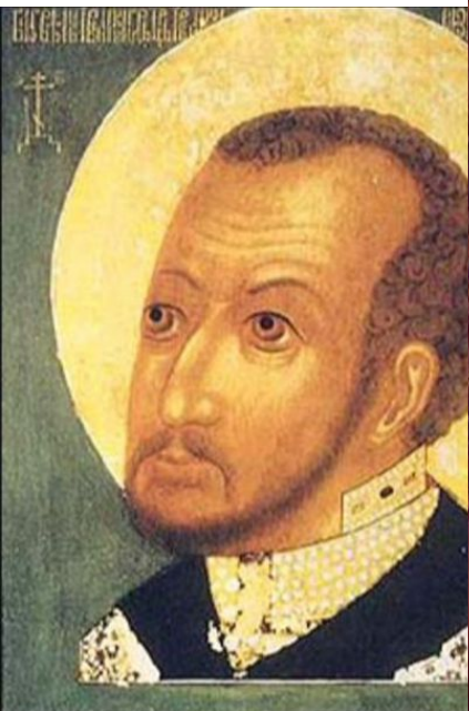
Федор Иванович (1584 - 1598)