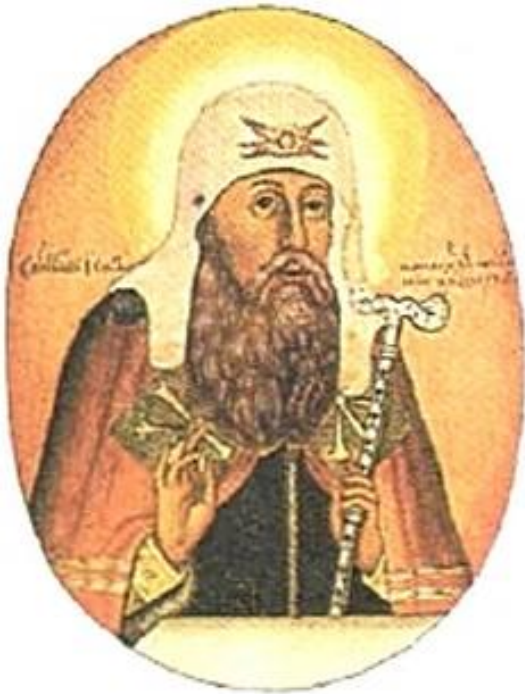
Патриарх Иов. Парусина XVII в.

1589 г. – глава русского православного духовенства Иов сменил сан митрополита на сан патриарха.