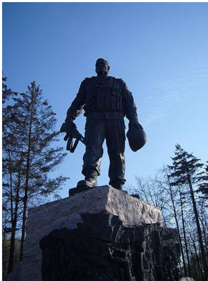
Памятник воинам-интернационалистам на Поклонной горе в Москве