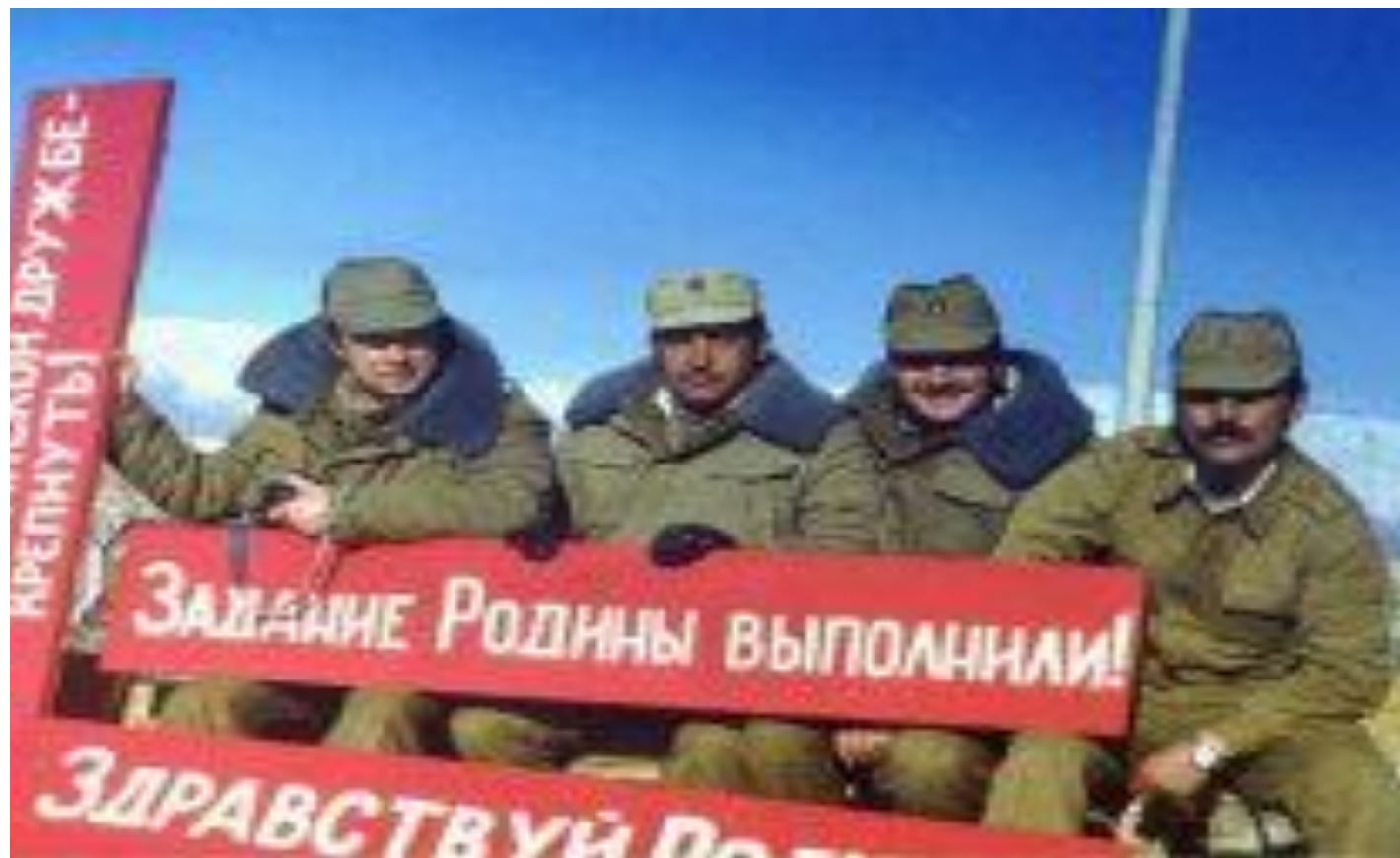
СОВЕТСКИЕ СОЛДАТЫ В Афганистане