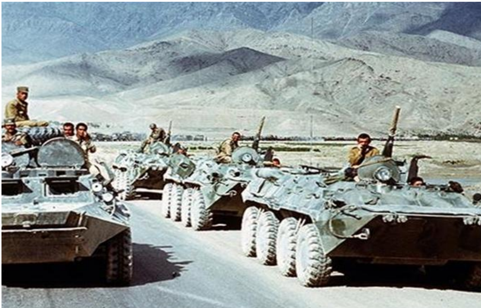
Колонна советской бронетехники на марше в горах Афганистана