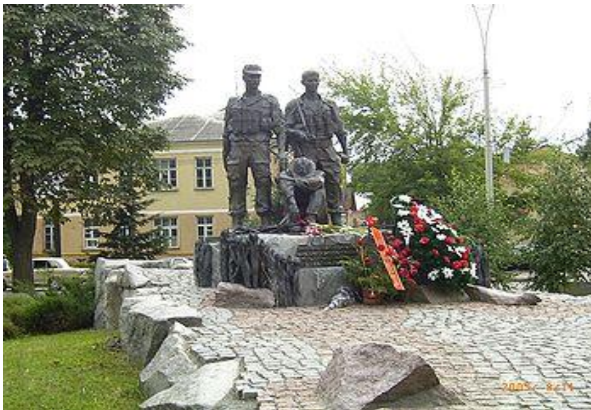
Памятник Воинам-Афганцам в Киеве