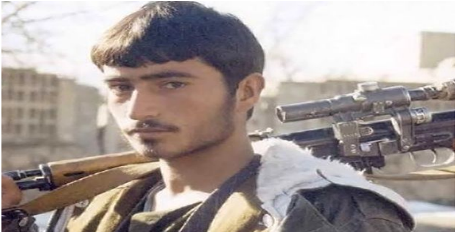
Моджахед, вооружённый советской ВИНТОВКОЙ