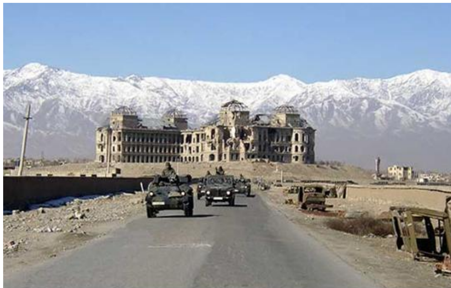
Дворец президента Афганистана Хафизуллы Амина после штурма его советским спецназом 27.12.1979 г.