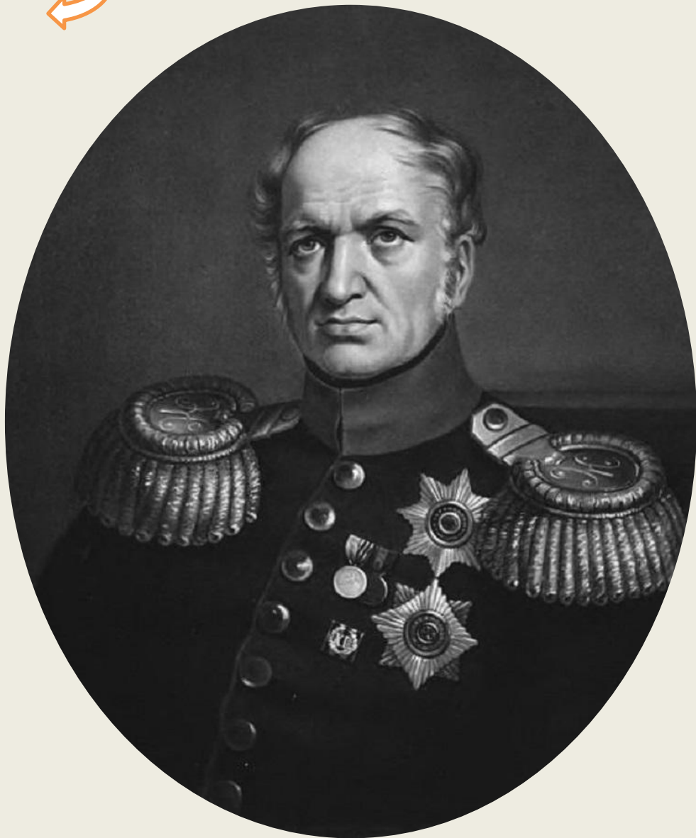
Егор Францевич Канкрин

Оценка деятельности Е. Ф. Канкрин на посту министра финансов, принадлежит П. Шмидту . Он считал, что главная заслуга Е. Ф. Канкрин заключалась в том, что он смог добиться бездефицитного государственного бюджета . Автор утверждал, что для денежной реформы, которую придумал Е. Ф. Канкрин, оказался очень выгодным прилив иноземной монеты в Россию. Он совершил переворот в российском денежном обращении на пользу не только страны и торговли, но и народа.