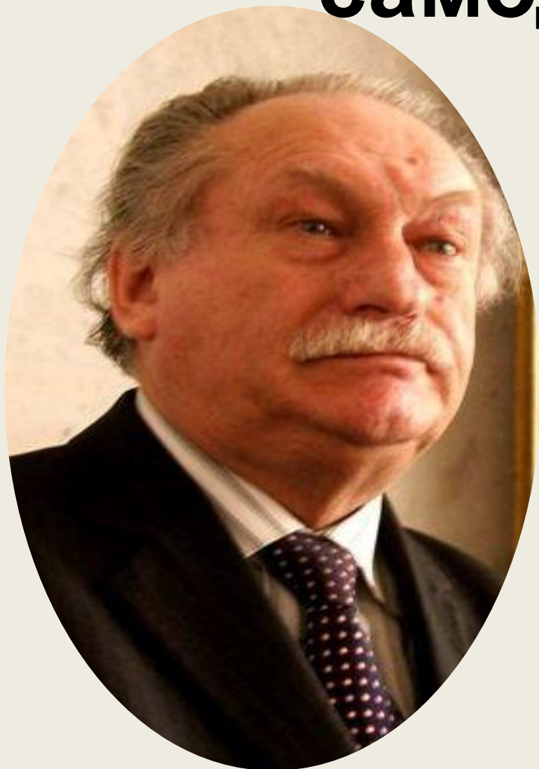
Гросул Владислав Якимович

В. Я. Гросул правление Николая I по-прежнему называет «апогеем самодержавия» : император, по его словам, «выжал из феодализма практически все, что мог». Согласно этому взгляду на эпоху правления Николая I, для нее было характерно отрицательное отношение к демократии, всемерное укрепление основ самодержавного строя.