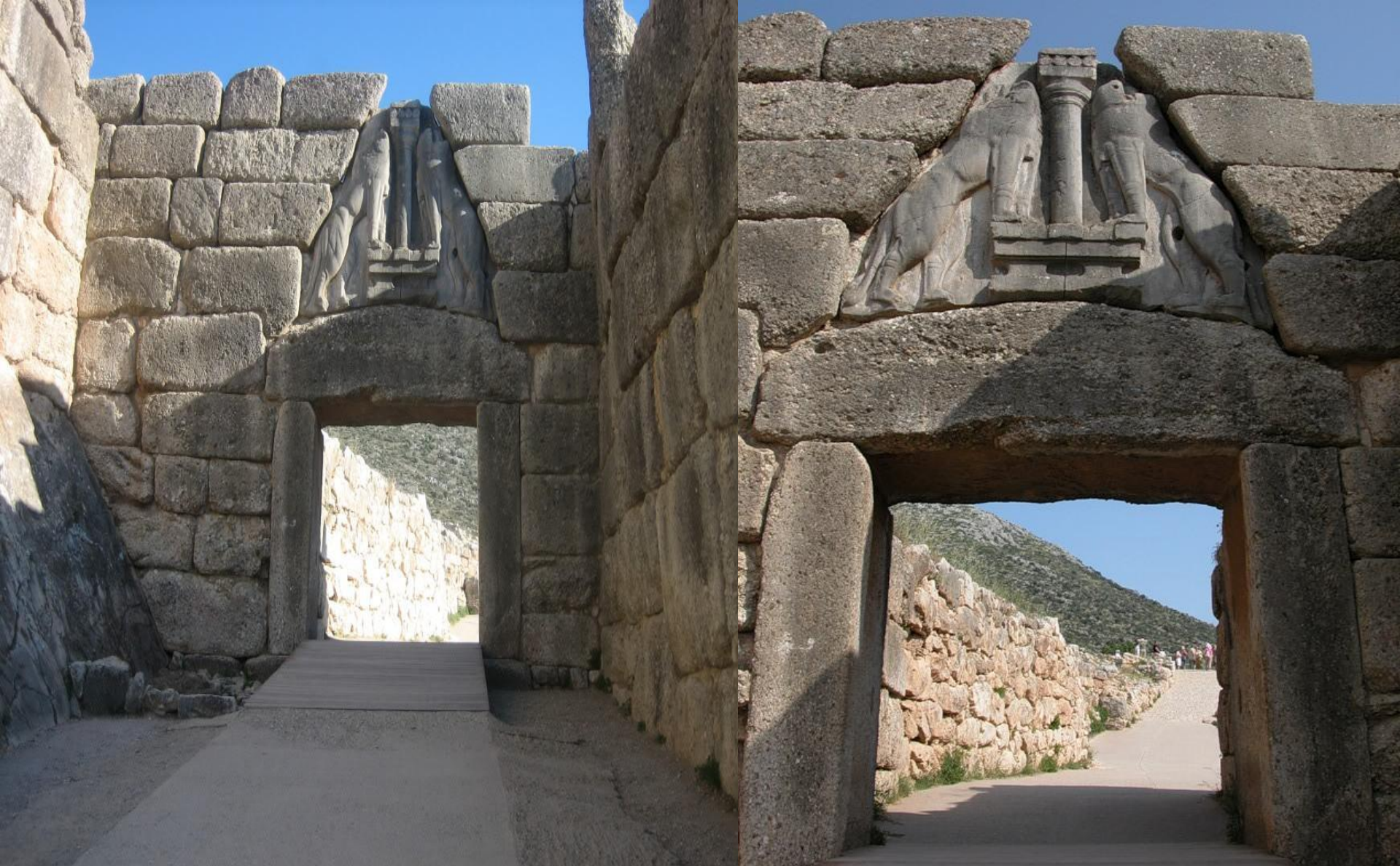
Микены қаласындағы “Арыстандар қақпасы”