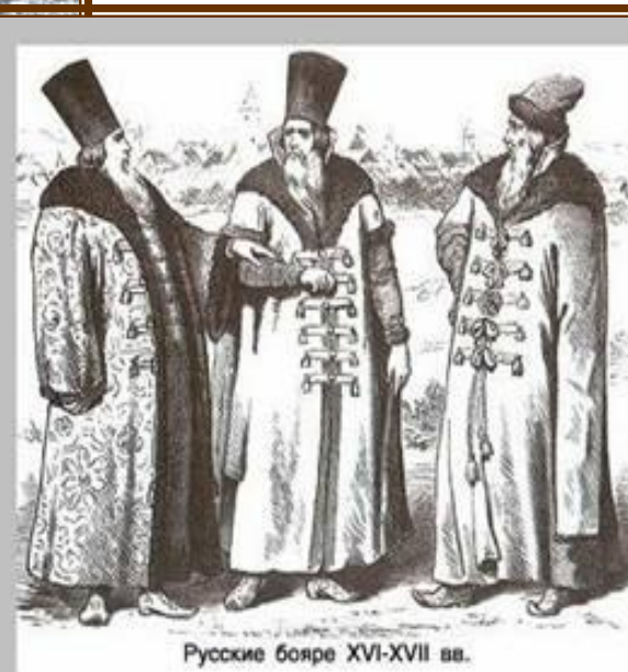
Русские бояре XVI-XVII вв.