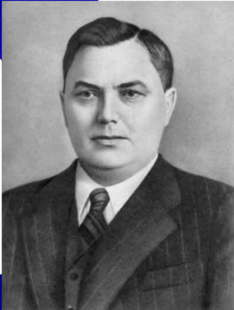
Г.Маленков - председатель Совета Министров

В ходе индустриализации соотношение между тяжелой и легкой промышленностью радикально изменилось: до 70% всех рабочих были заняты к этому времени в тяжелой индустрии, доля средств производства в ее продукции также достигала 70%. Исходя из этого, Маленков предложил перенести центр тяжести на развитие легкой и пищевой промышленности.