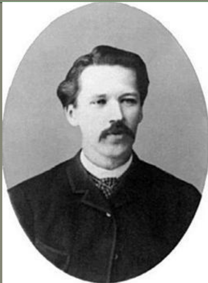
Начальник охранного отделения С.В. Зубатов

«Зубатовский (полицейский) социализм» - попытка царского правительства отвлечь рабочих от революционной борьбы путем создания легальных рабочих организаций под опекой департамента полиции (1901–1903).