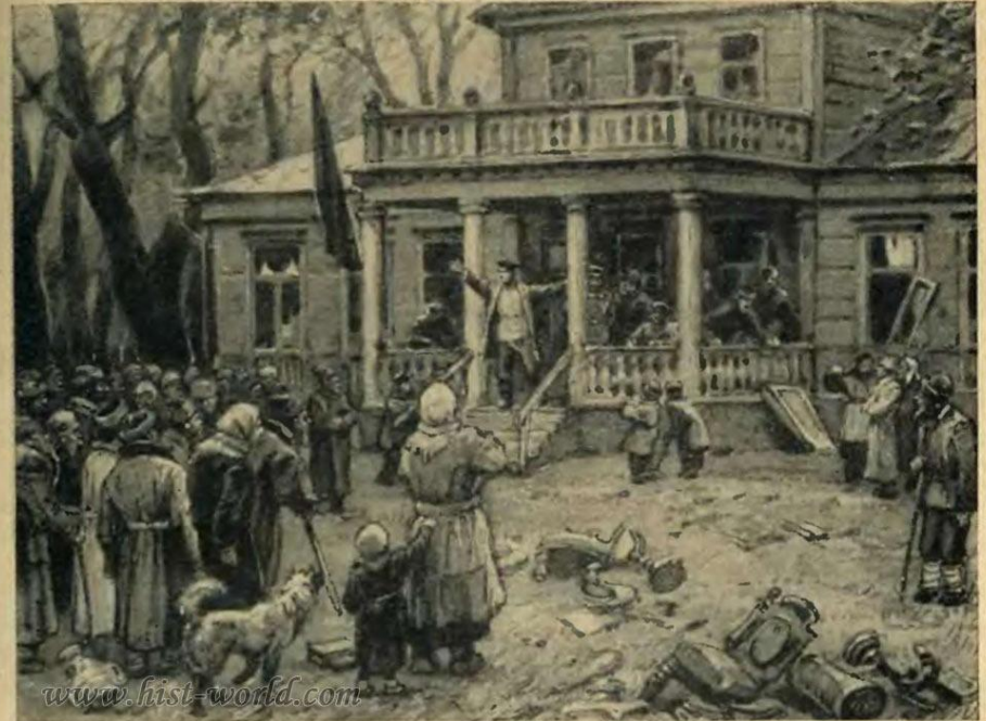
Разгром помещичьей усадьбы крестьянами в 1905 году.

Крестьяне разгромили усадьбу. Оконные рамы сорваны. На двор выброшены мебель и другие вещи. Из города приехал рабочий, он поднял красный флаг. Стоя на крыльце, он говорит крестьянам, что надо идти против царя. Крестьяне задумались, они слушают, но против царя идти не хотят.