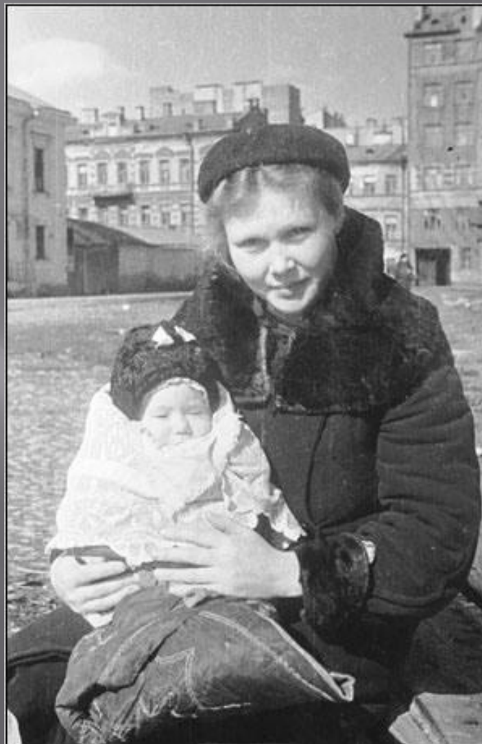
Мать и ребенок в блокадном Ленинграде

1943 г. – создан новый Гимн СССР (слова Александрова, музыка Михалкова)