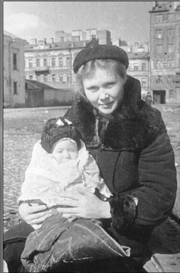
Мать и ребенок в блокадном Ленинграде

1943 г. – создан новый Гимн СССР (слова Александрова, музыка Михалкова)