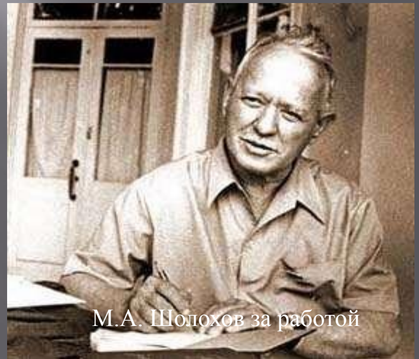
М.А. Шолохов за работой