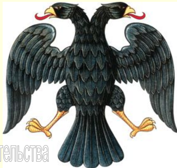
Герб временного правительства