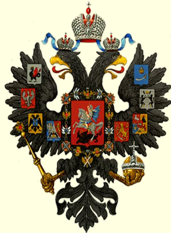
малый герб Российской империи

И окончательно проекты гербов утвердил уже Александр III в 1882-1883 гг.