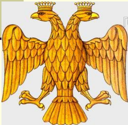
герб при иване III

После Февральской революции Временное правительство не отказалось от герба, но сильно изменило его внешний вид. Имперский герб «разгрузили»: убрали короны, скипетр, державу, гербы царств и земель, орденскую цепь, т.е. вернулись государственному гербу времен Ивана III. Таким он был до апреля 1918 г. и при новой власти был отменен.