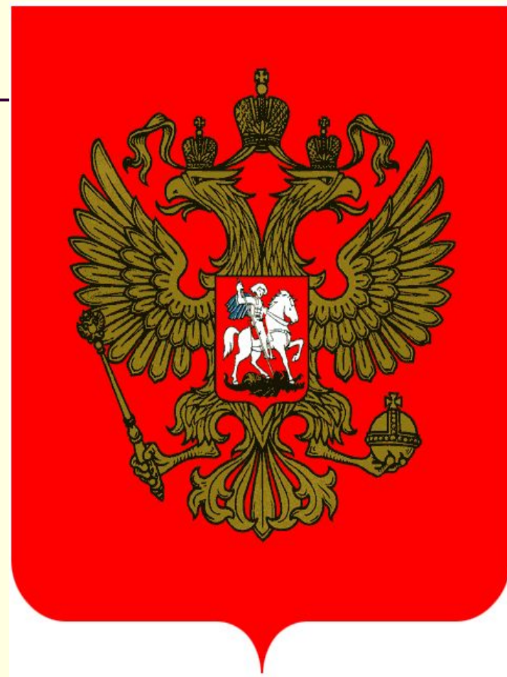
Герб Российской Федерации образца 1993г.

Двуглавый орел – символ власти, силы, мудрости, единения народов, живущих в европейской и азиатской частях Российской Федерации. Короны можно рассмотреть как символы трех ветвей власти – исполнительной, законодательной и судебной. Скипетр – защита независимости всей России и ее территорий, республик. Держава – символ единства государства. Всадник, поражающий змея, св. Георгий Победоносец – символ борьбы добра со злом.