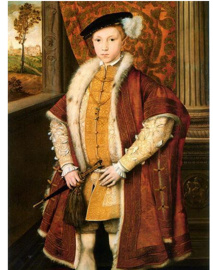
Эдуард VI портрет работы Ганса Эворса

Генрих VIII стал одеваться в этом стиле после того, как увидел одежду нанятых им ландскнехтов. Дети Генриха, Эдуард VI и Елизавета I также одевались в этом стиле.