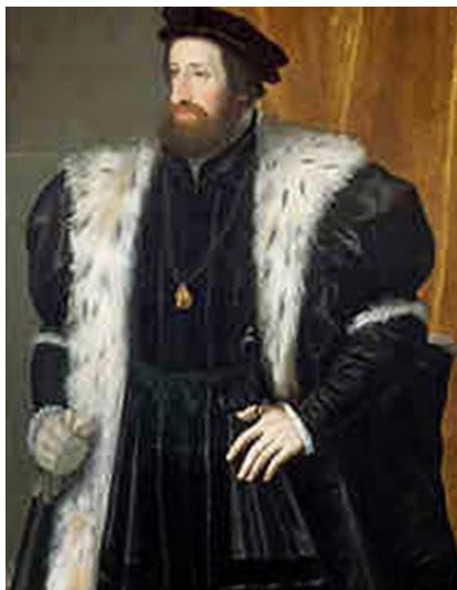
Император Фердинанд I

Благородный вкус итальянца, развитый благодаря его богатому искусству, умеет придать красоту даже такому неуклюжему явлению, которым была господствовавшая тогда мода.