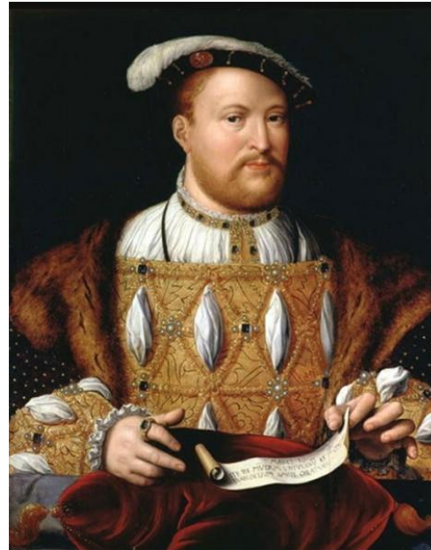
Йос ван Клеве портрет Генриха VIII