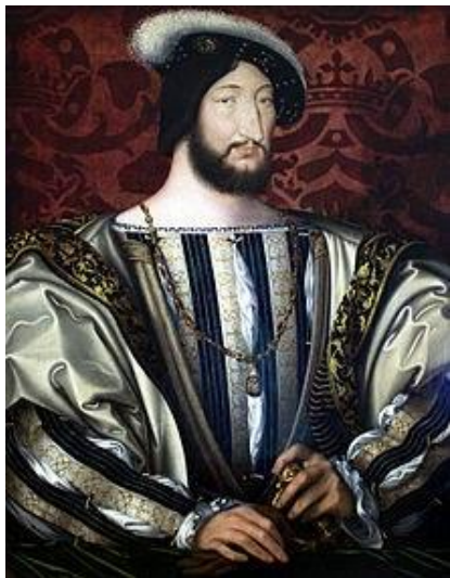
Король Франциск I

Каждая страна вносит в однотонную испанскую моду нечто своеобразное.