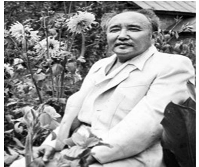
МҰХТАР ӘУЕЗОВ (1897-1961)

Этнопедагогика негіздерін өмірге етене енгізу нәтижесінде білім берудің барлық нүктелерінде жас ұрпақты халықтың салт-дәстүрлеріне сай тәрбиелеу жұмыстары жүргізілуде. Әсіресе соңғы жылдары республикада ұлттық мәдениет пен өнердің озық үлгілерін әлемдік айналымға шығару, сол арқылы Дүние жүзі қауымдастығына танылу жолдары қарастырылуда. Жамбылдың 150 жылдығының аталып өтуі, 1997 жылы М.Әуезовтің 100 жылдығының тойлануы, 1999 жылы Түркістанның 1500 жылдығы кең көлемде мерекеленуі тәуелсіз жас мемлекеттің бұл бағыттағы тарихи құтты қадамдары болса керек.