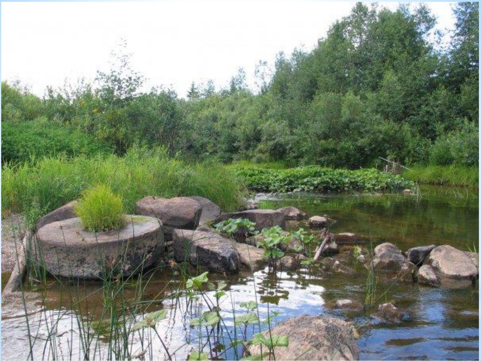
Остатки мельницы у д. Нагорье