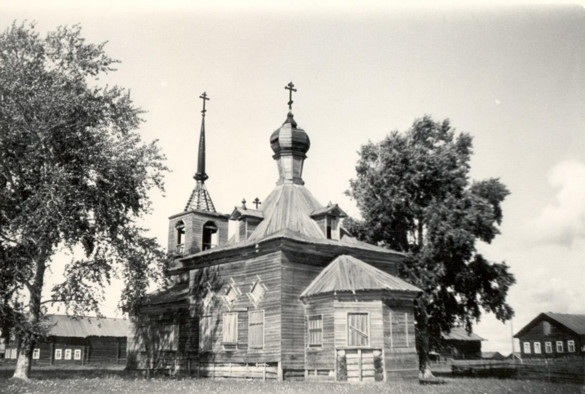
Сретенская церковь в Городке