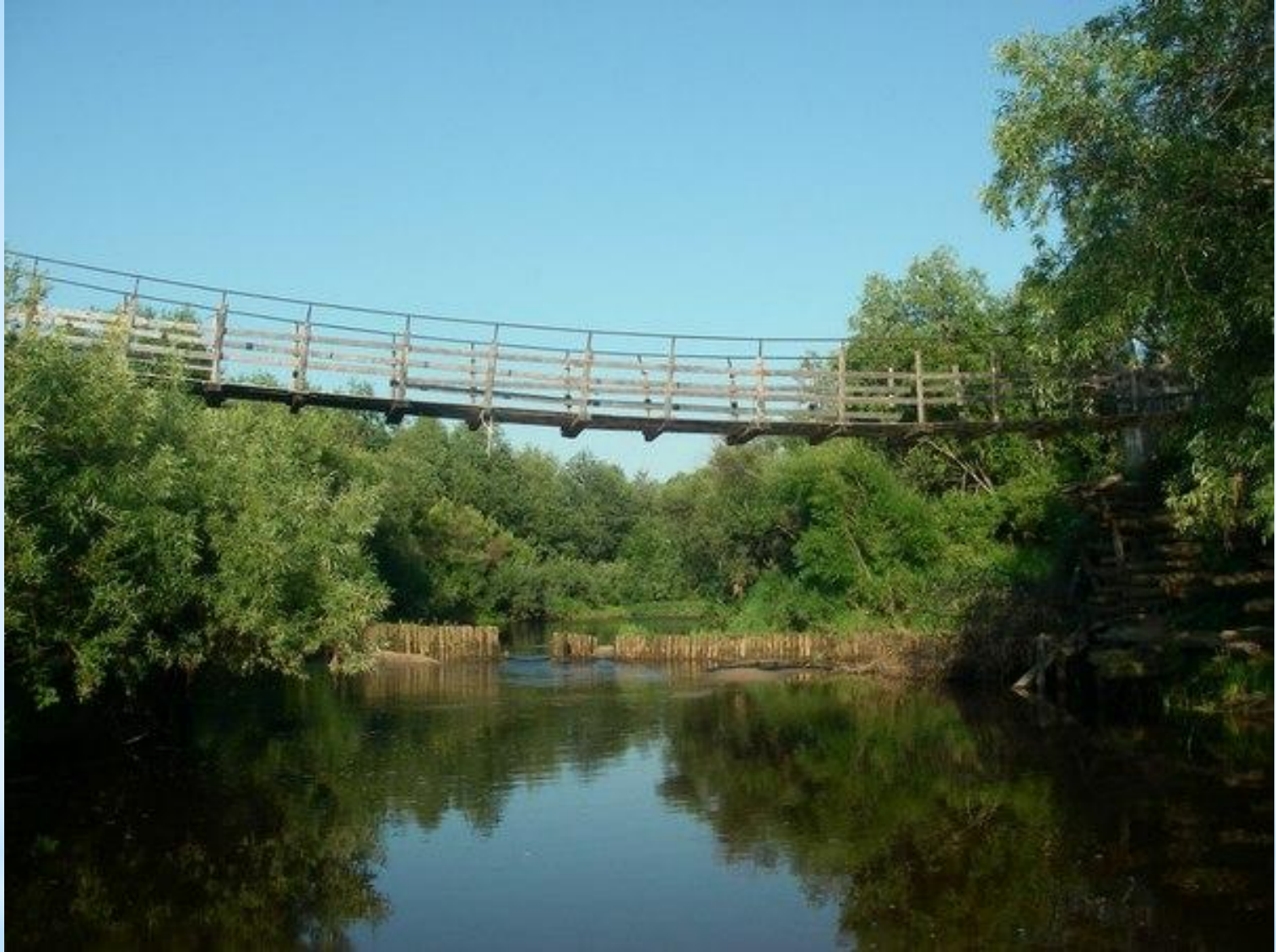
Подвесной мост через Тёду