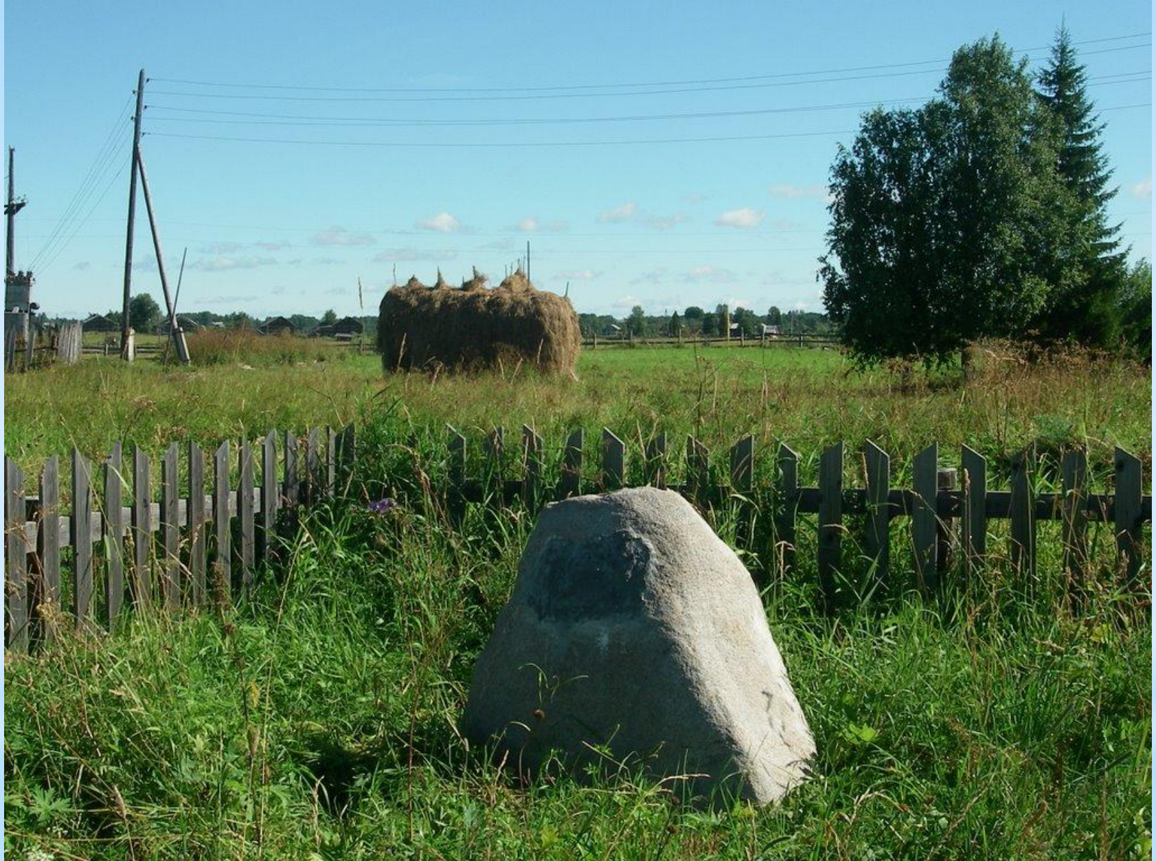
Камень в деревне откуда согласно легенды родом Ермак.