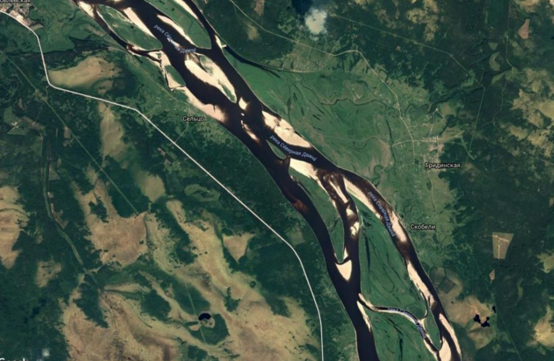
Вид на Борок из космоса