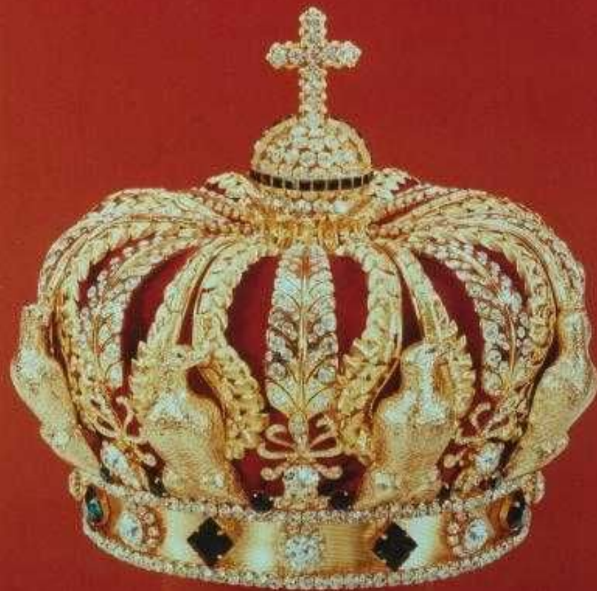
Корона Наполеона III

Провозгласил себя императором. Период Второй империи