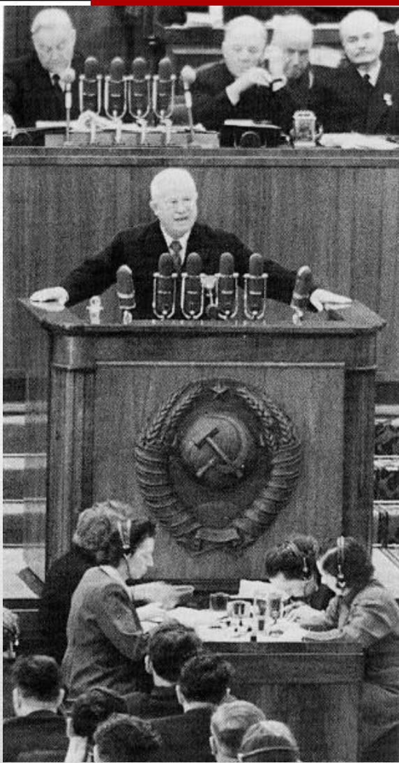
Первый секретарь ЦК КПСС Н.С. Хрущев на трибуне XX съезда КПСС.