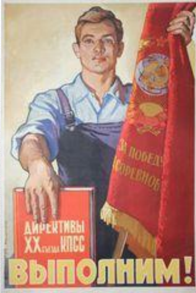
Плакат 1956 г.

С отчетным докладом ЦК выступал Н.С. Хрущев.