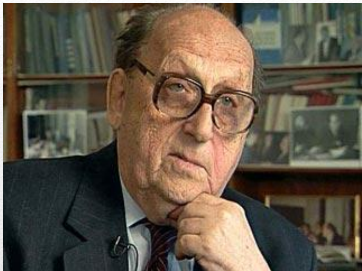
Георгий Аркадьевич Арбатов.

Чем объяснялась такая реакция общества на доклад Хрущева?