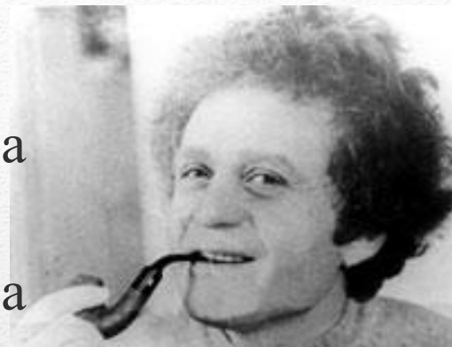
Юрий Федорович Орлов

Выступление сотрудников Теплотехнической лаборатории АН СССР, в особенности Ю.Ф. Орлова, было даже осуждено специальным Постановлением ЦК КПСС.