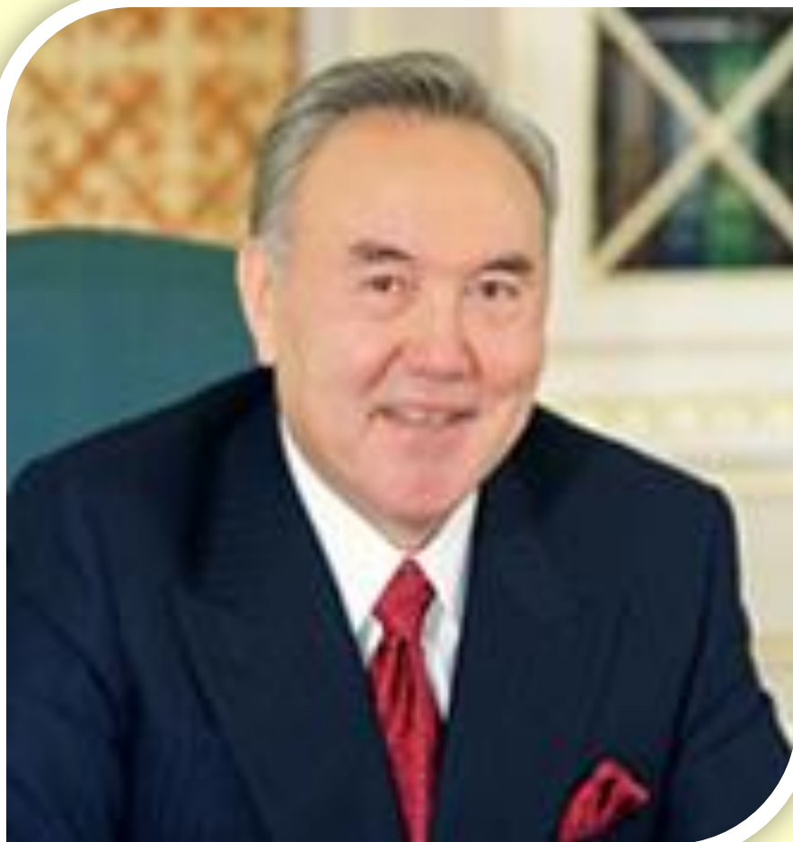
Назарбаев Н.А. Президент РК (Раздел III)