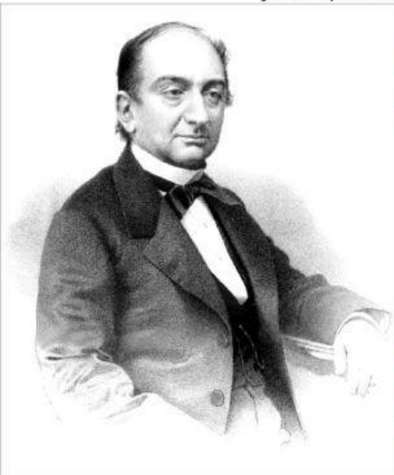
Иван Делянов (1818-1897)

В 1884 г. был издан новый университетский устав . Ректоры, деканы, профессора отныне не избирались, а назначались министром просвещения. Университетский суд ликвидирован, полиция получила право доступа в университеты. По существу, университетская автономия уничтожена.