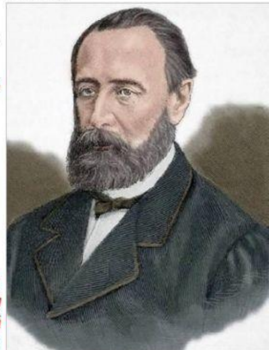
Михаил Катков (1818-1887)

«Новый университетский устав важен не для одного учебного дела, он важен еще и потому, что полагает собой начало новому движению в нашем законодательстве: как устав 1863 г. был началом системы упразднения государственной власти, так устав 1884 г. представляет собой возобновление правительства, возвращение властей к их обязанностям».