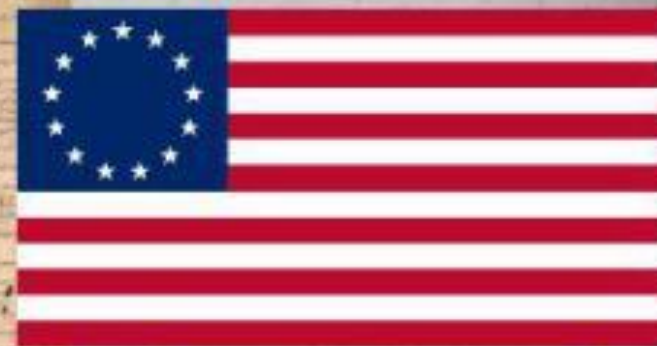
первый флаг США (13 штатов)