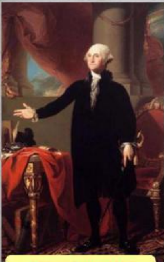
Джордж Вашингтон 1-й президент США

Устанавливался республиканский строй и федеративное устройство