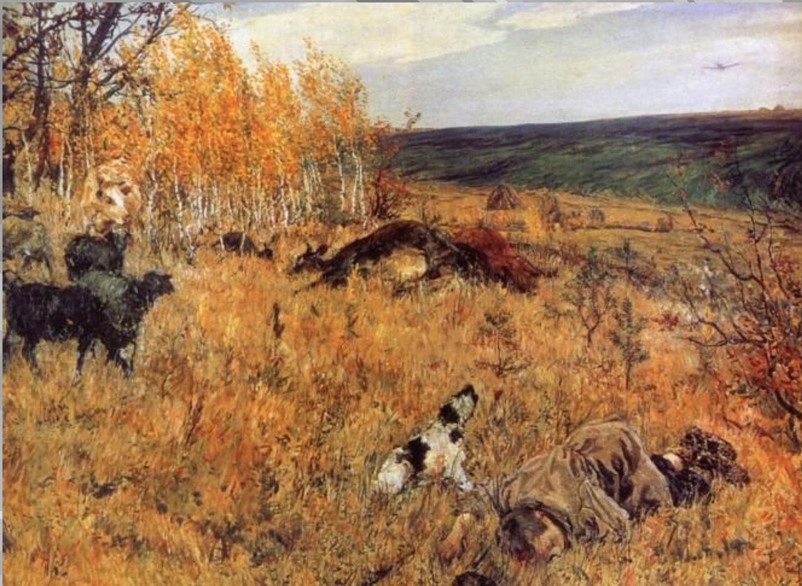
Пластов А. «Фашист пролетел» 1942