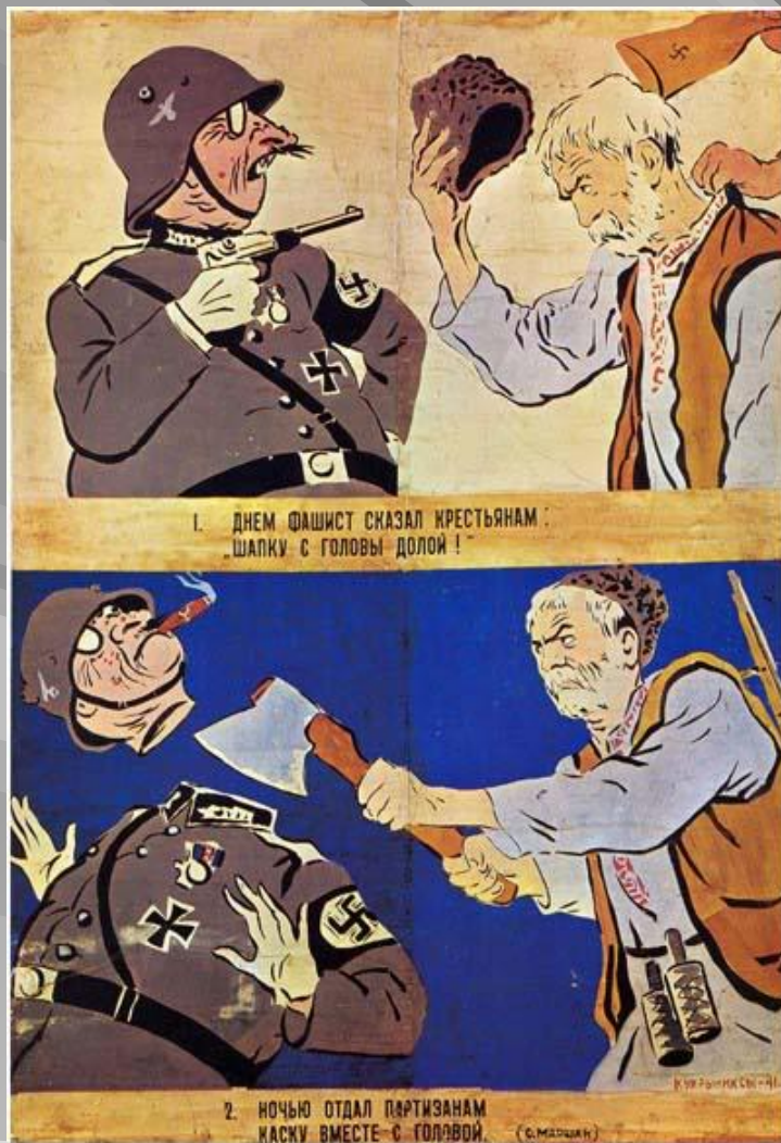
Кукрыниксы. «Долг платежом красен»