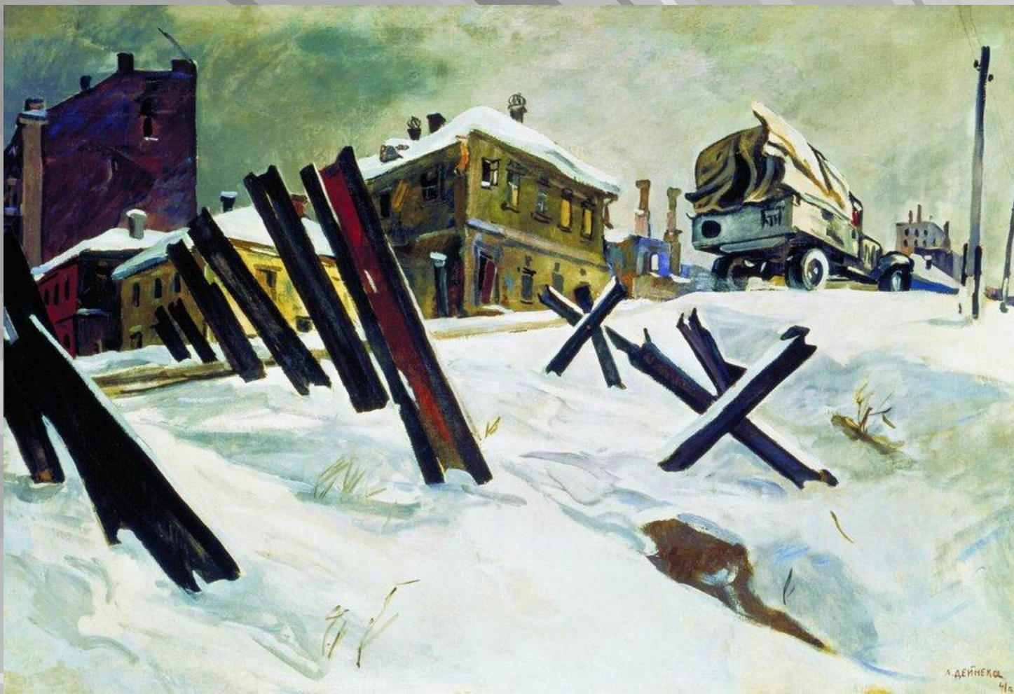
Дейнека А. «Окраина Москвы. Ноябрь 1941 года»