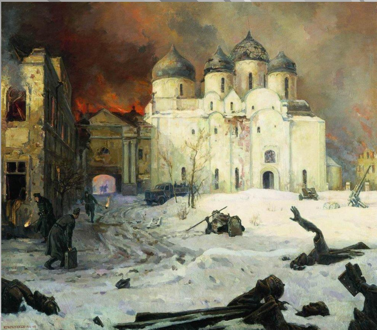
Кукрыниксы «Бегство фашистов из Новгорода» 1944-1946