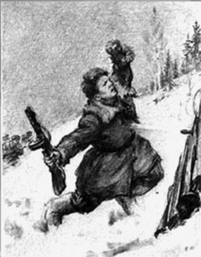
Н. Жуков «Подвиг Александра Матросова»