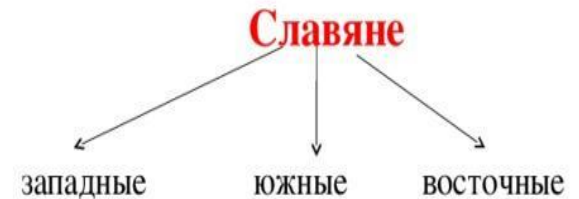
Схема Происхождение славянских народов