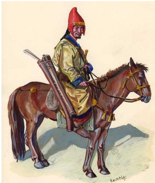
Гунны - кочевники

Расселение славянских племен совпало по времени с Великим переселением народов