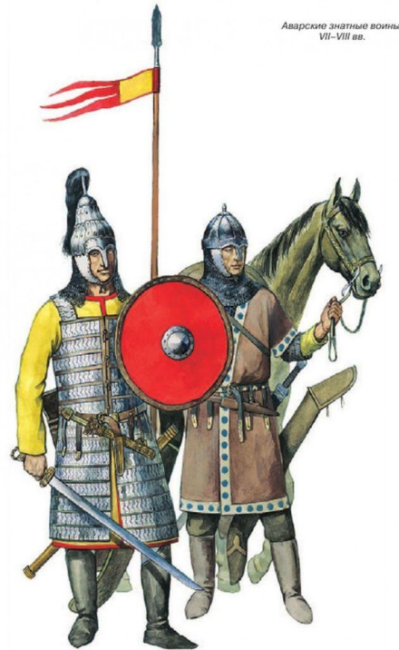
Аварские знатные воины. VII-VIII вв.