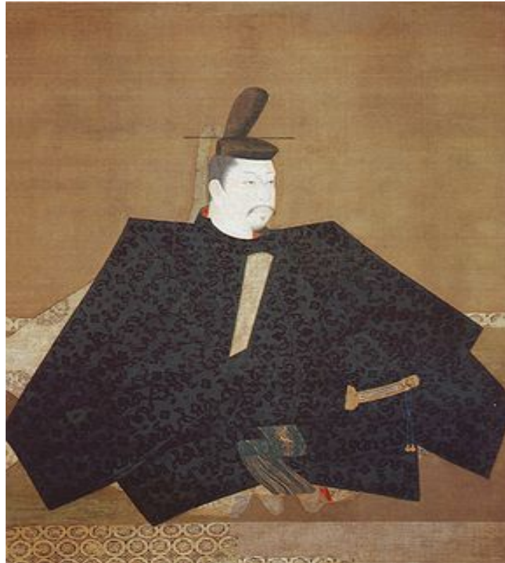
Минамото Еритомо бірінші сегун