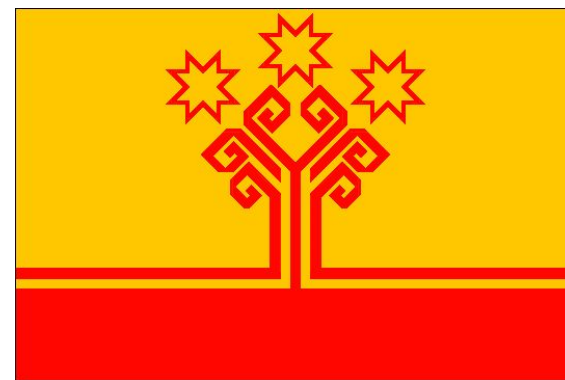
Флаг Чувашской республики от 29.04.1992