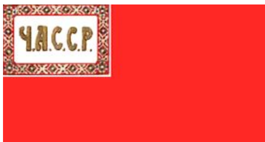
Первый флаг ЧАССР 1926