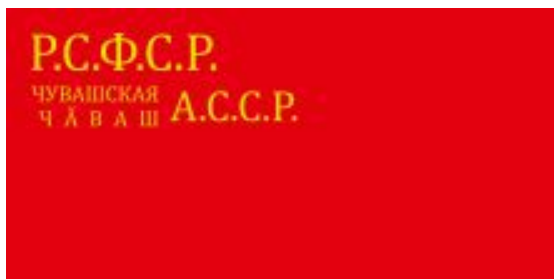
Флаг ЧАССР образца 1940 года.