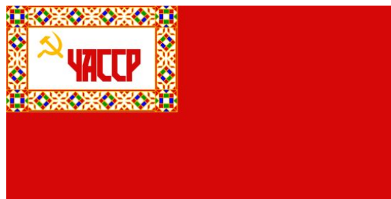
Флаг ЧАССР образца 1927 года.