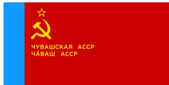
Флаг ЧАССР образца 1978 года