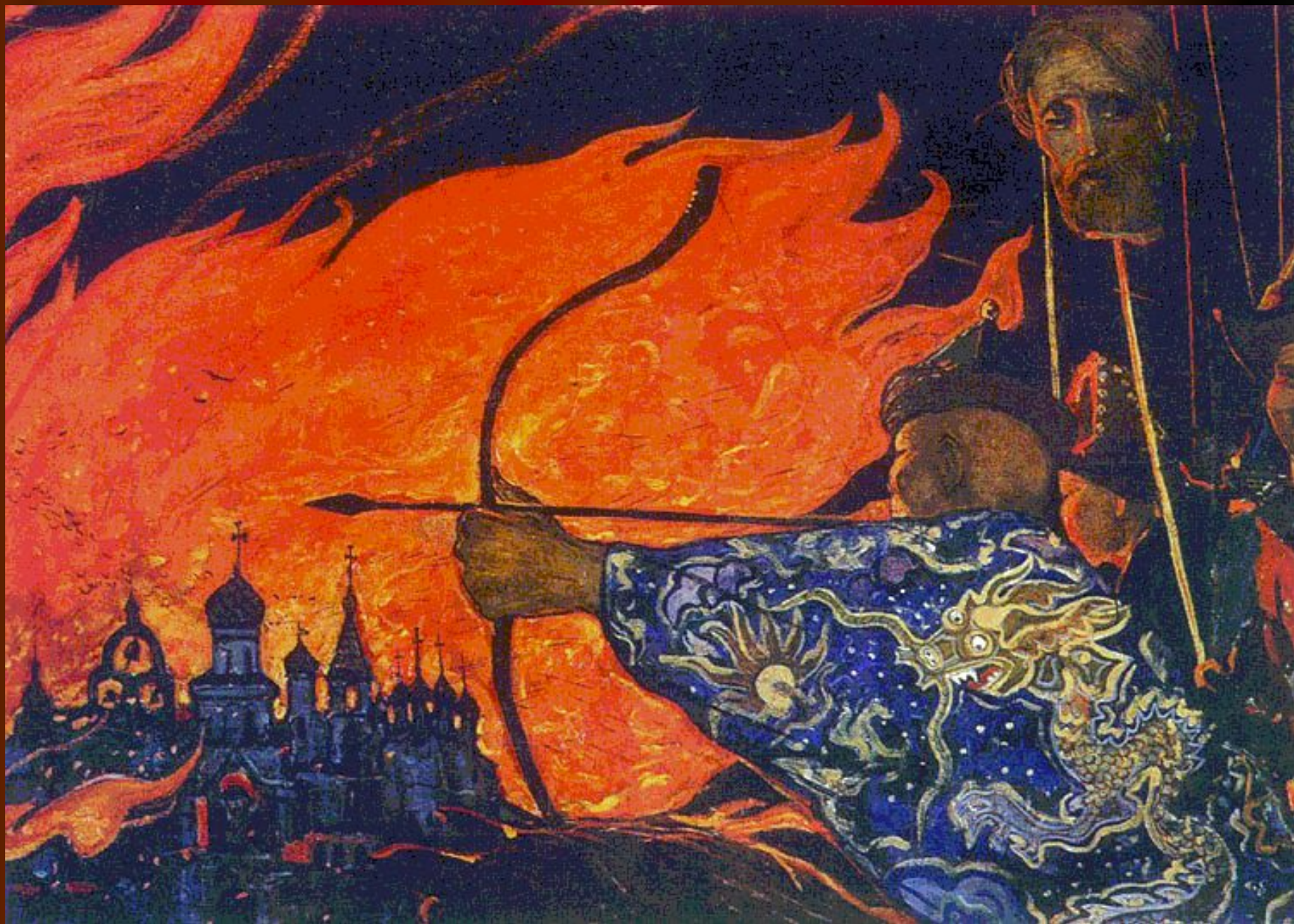
И.Глазунов. Штурм города.