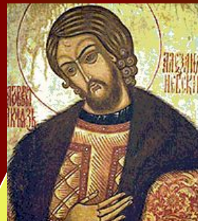
Александр Ярославич (Невский)