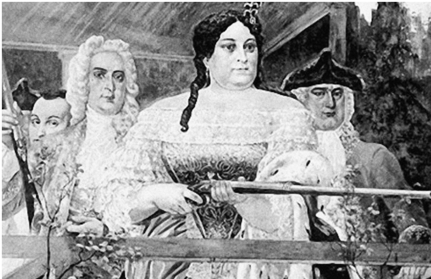
А. Рябушкин «Императрица Анна Иоанновна в Петергофском зверинце на охоте», 1900-е гг.

Грубая, недалекая, жестокая Анна Иоанновна предпочитала всем высоким развлечениям охоту, точнее стрельбу в живую мишень. «Во время пути изволила Ея величество в Стрельной мызе стрелянием по птице и в цель забавляться». Так написано в газете 1737 г.