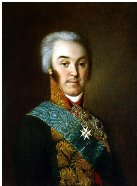
Николай Петрович Шереметев (1751—1809)