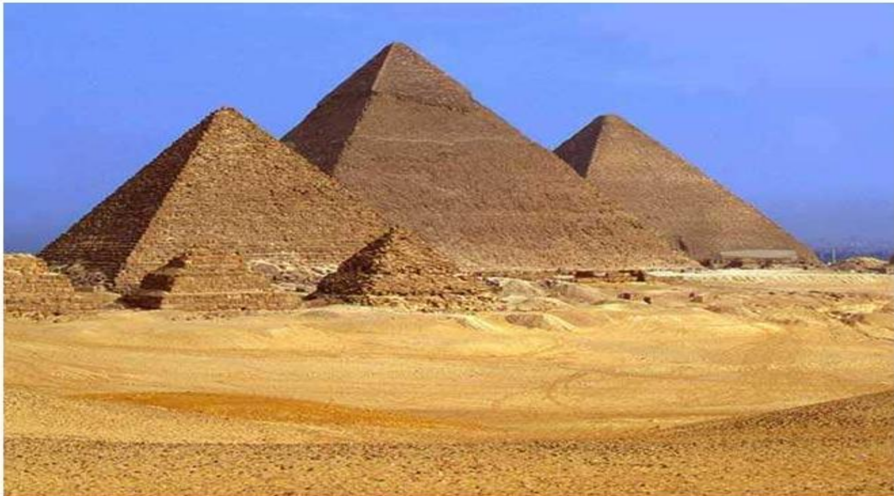
Египетские пирамиды в Гизе