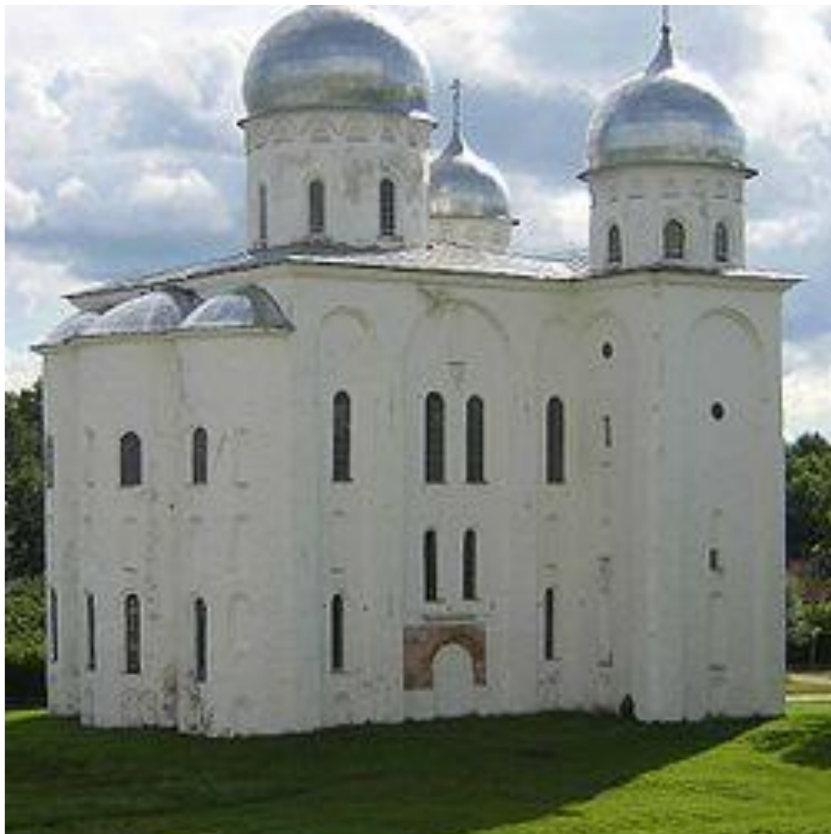
ГЕОРГИЕВСКИЙ СОБОР ЮРЬЕВА МОНАСТЫРЯ