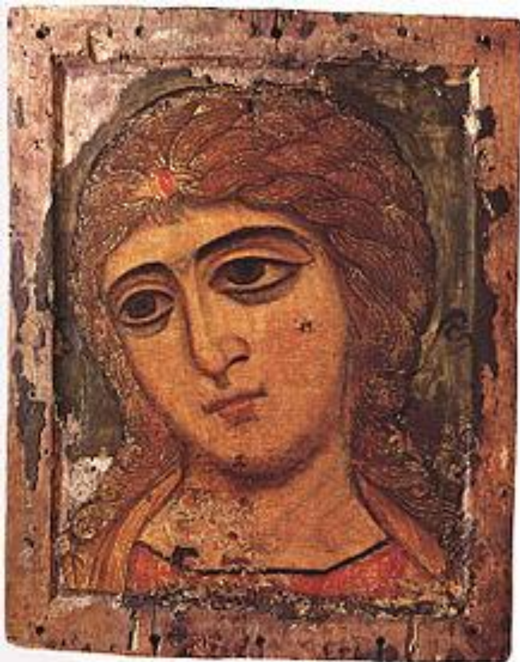
«АНГЕЛ ЗЛАТЫЕ ВЛАСЫ» - ИКОНА АРХАНГЕЛА ГАВРИИЛА