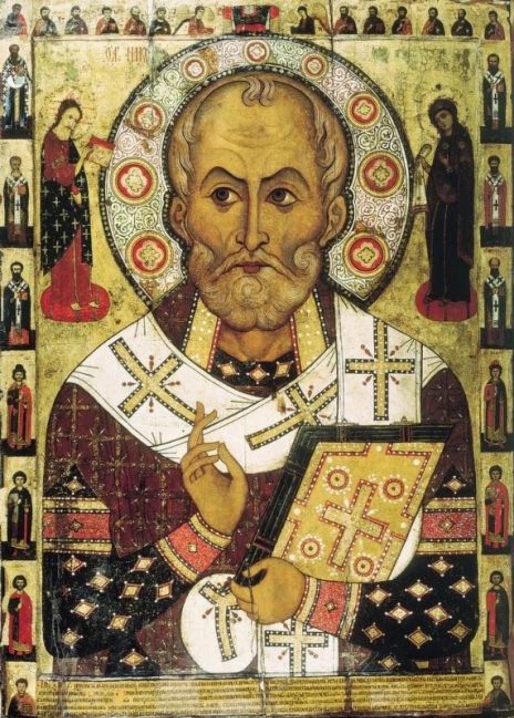
ИКОНА «НИКОЛАЙ ЧУДОТВОРЕЦ» (АЛЕКСЕЙ ПЕТРОВ, 1294)