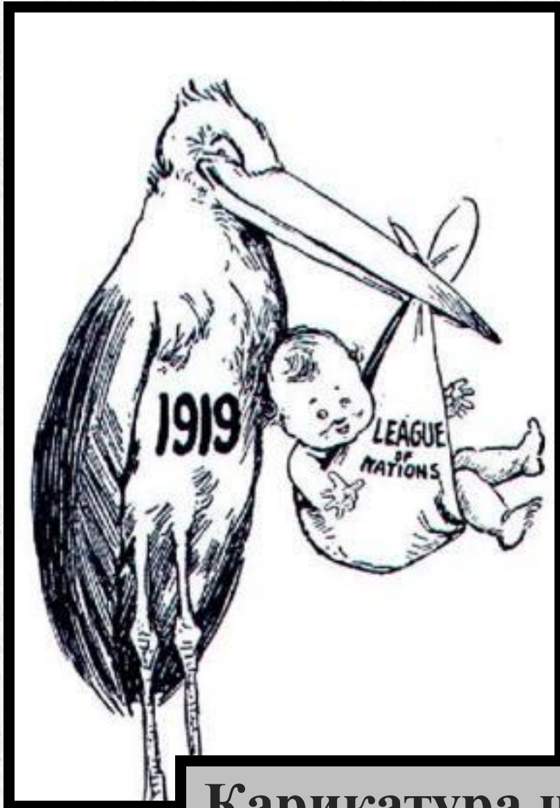
Карикатура на Лигу Наций

Найдите статьи договора, которые могут препятствовать поддержанию стабильности и мира.